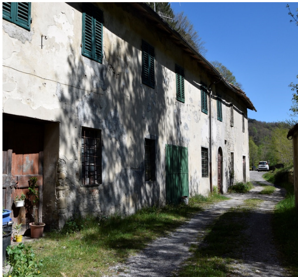
LOC. PRACCHIA, via Nazionale 30, Pistoia