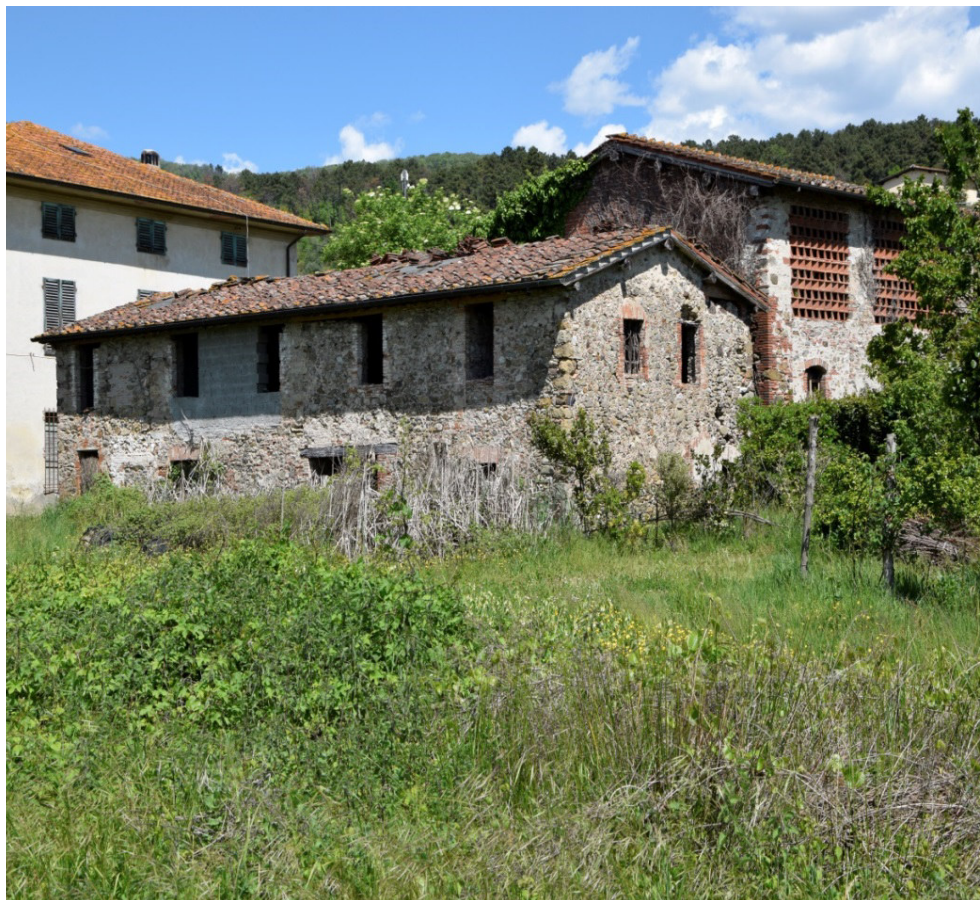
Via per Camaione, IV Traversa – Lucca