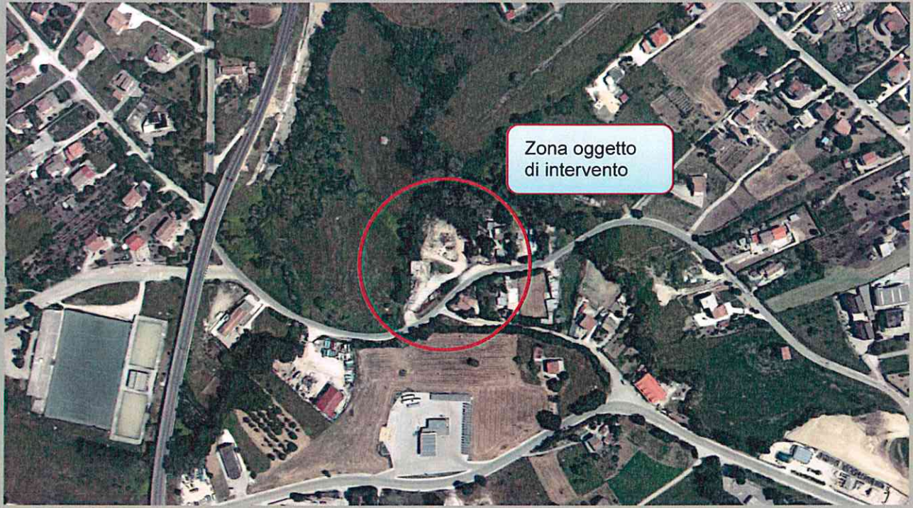
CAMPOBASSO, CONTRADA SELVA PIANA