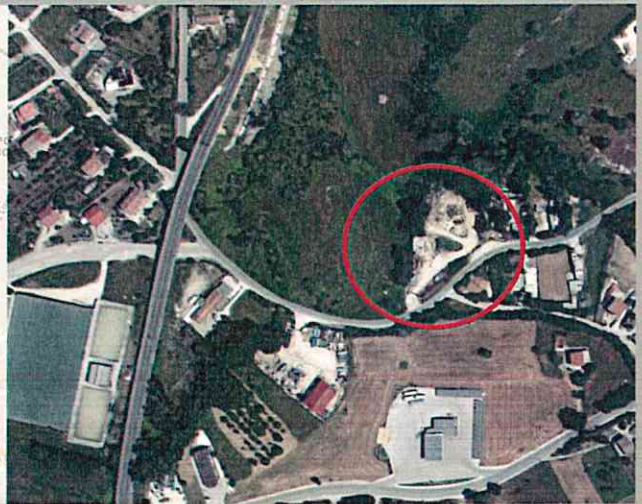
EX IMPIANTO DI BETONAGGIO - 41°34'12.7"N 14°38'17.9"E