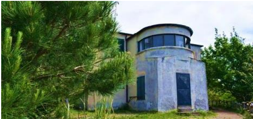
Località Semaforo Nuovo, Camogli (GE)

Proprietà: Stato Strumento: Concessione/Locazione di valorizzazione ex art. 3-bis D.L. n. 351/2001 conv. in L. 410/2001 Epoca: 2a metà del XIX sec. Superficie fondiaria: 5.974 mq Superficie lorda: circa 282 mq Provvedimenti di tutela: SI Usi ammessi: turistico-ricettivo e/o culturale