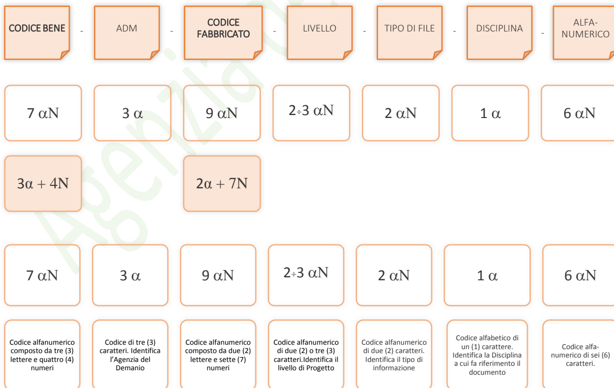
Esempio di codifica dei modelli

Di seguito è riporta lo schema tipico della codifica su citata a titolo esemplificativo e non esaustivo: