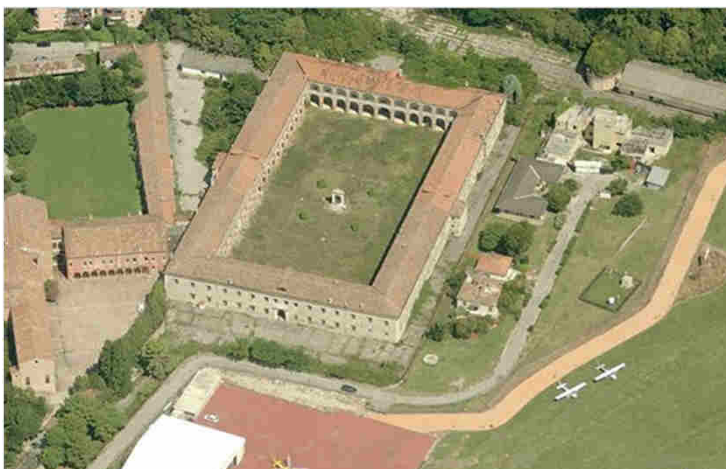
Via Renato Morandi- Venezia – Lido Loc. San Niccolò