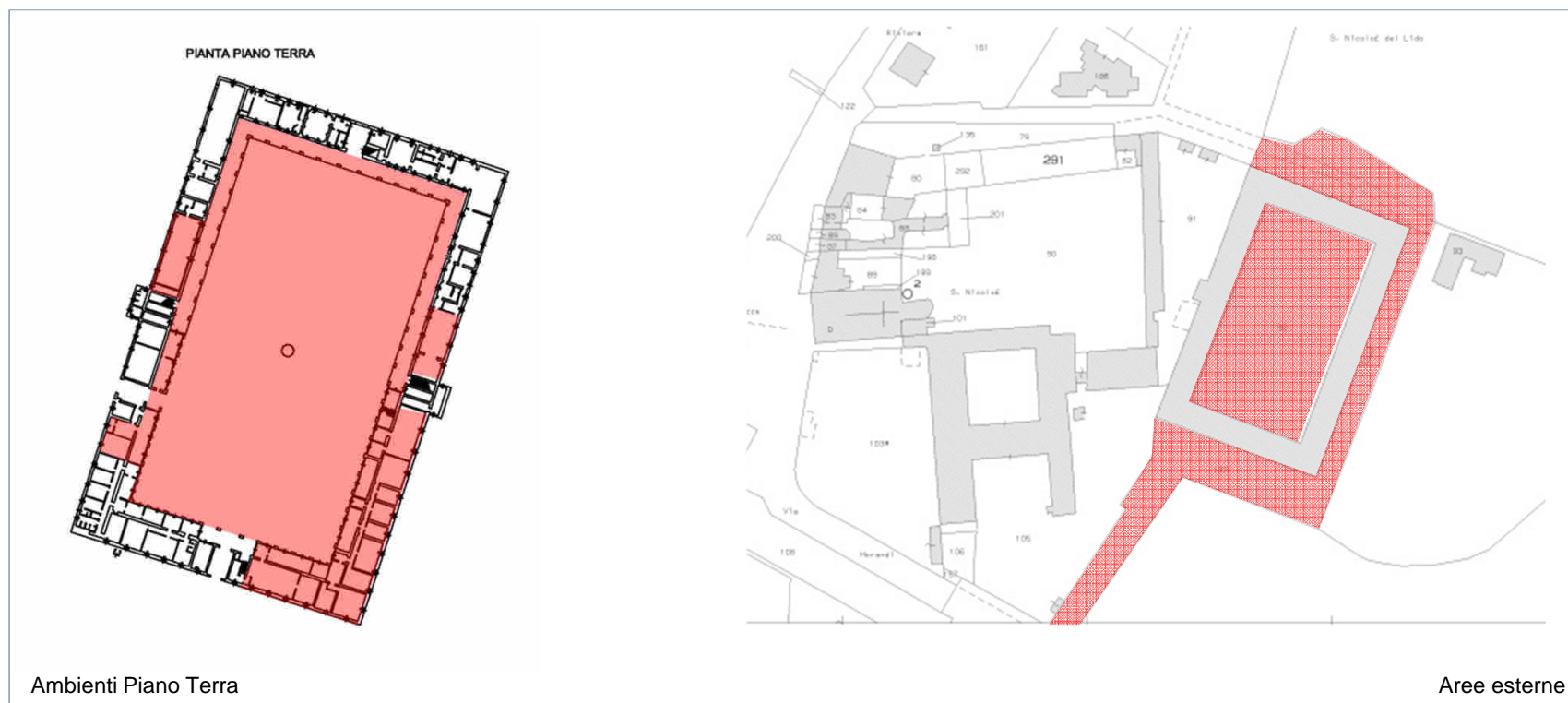
Ambienti Piano Terra