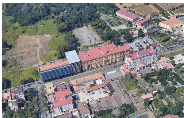
Villa Favorita ERCOLANO – NAD0072