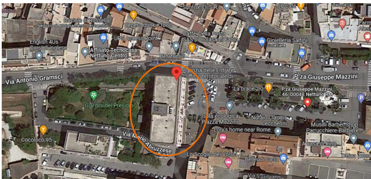
Figura 04 – vista aerea del complesso edilizio

La struttura portante verticale è in muratura mentre gli orizzontamenti sono costituiti da volte in mattoni al calpestio del piano terreno e solai in putrelle di ferro e voltine di mattoni ai piani in elevazione.