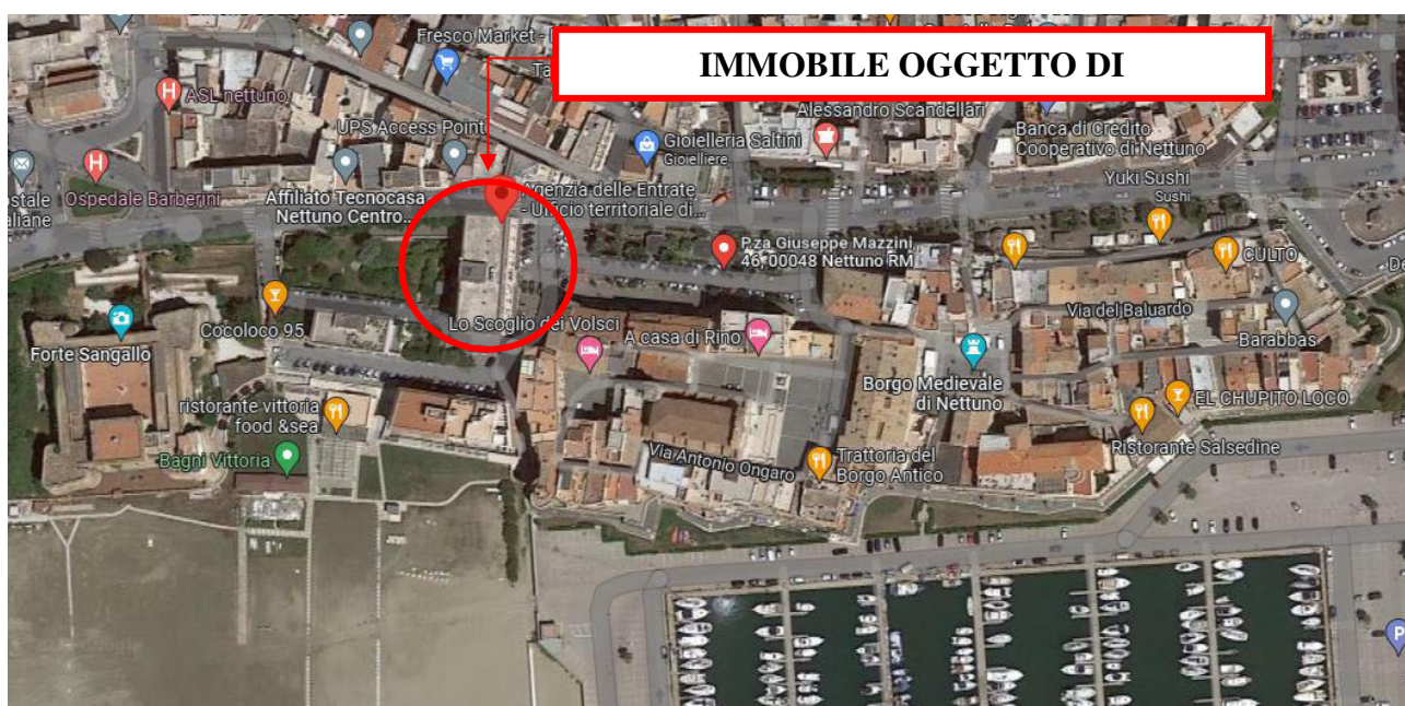
Figura 02- Veduta aerea del cespite

L'immobile oggetto di intervento, risulta censito, nel Catasto Fabbricati del Comune di Nettuno (RM), in testa a "DEMANIO DELLO STATO", come segue: