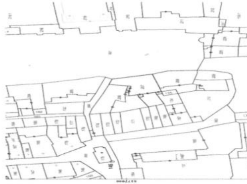
estratto di mappa