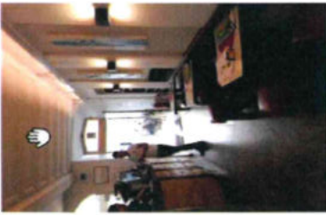
interno bar - gelateria