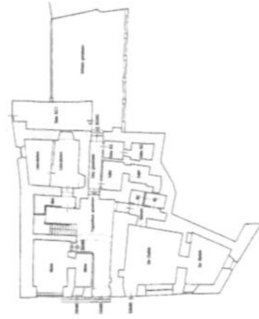
Progecohaus n° 11/11

Klimahaus Energieausweis: ausgestellt am 12.09.2016