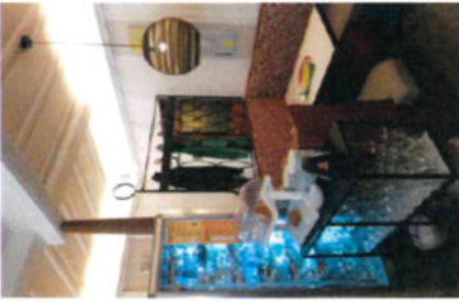
interno bar - gelateria