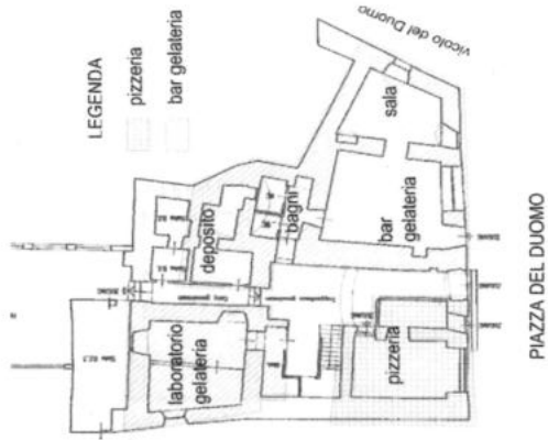
disposizione dei locali interni