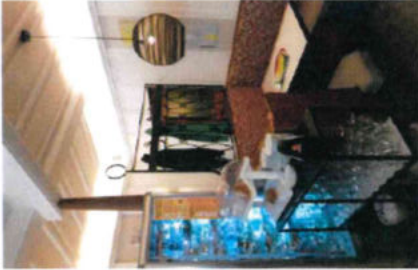
interno bar - galleria