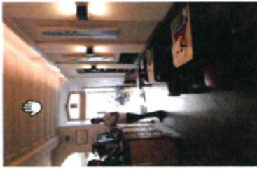
interno bar - galleria