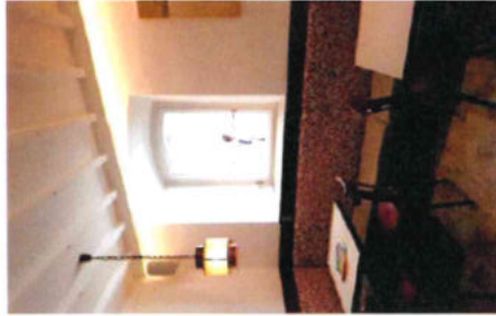
interno bar - galleria