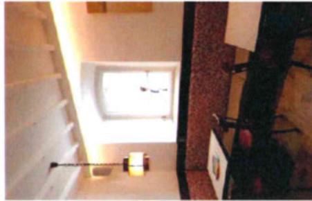
interno bar - gelateria