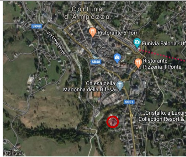
Foto del bene oggetto di locazione