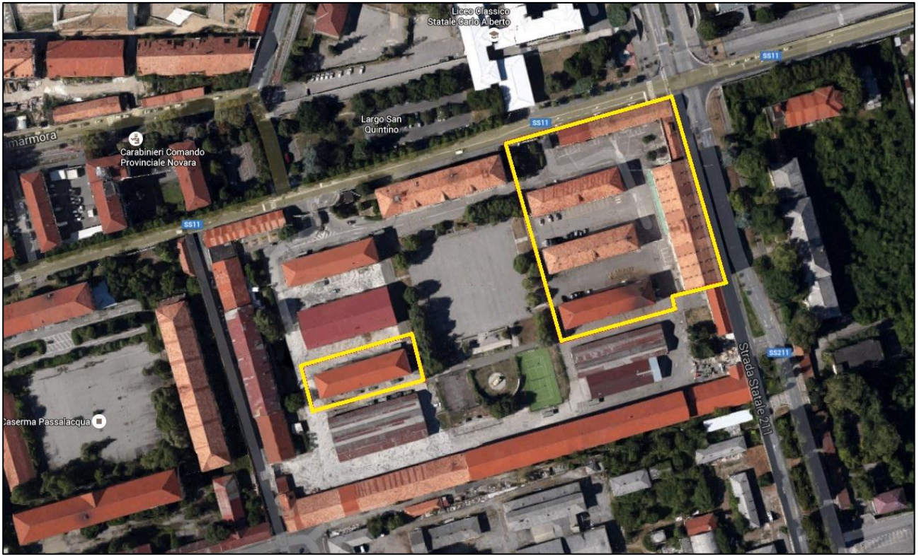
Individuazione dell'immobile (due perimetri gialli)