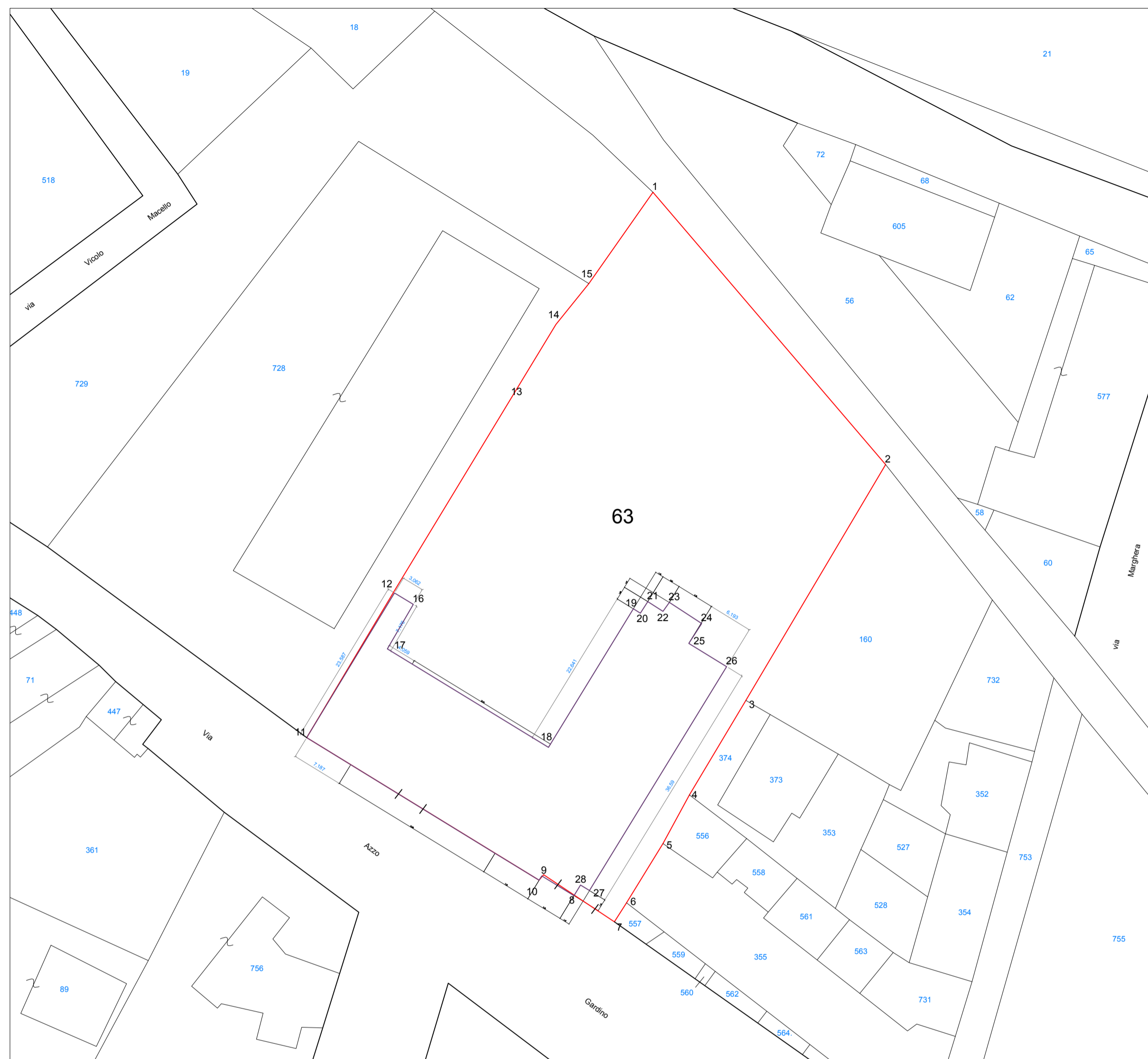
MAPPA CATASTALE CON RILIEVO DI VERIFICA DEI PUNTI PLANIMETRICI