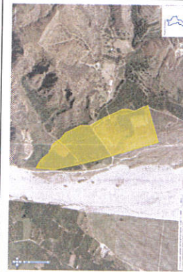
Perimetro particella 84

Descrizione: Terreno pianeggiante di mq. 3300 sito nella sponda sinistra della fiumara Amendolea facente parte della Scheda RCB0701, identificato al C.T. fg. 53 porzione delle p.lle 84/d con accesso dalla porzione p.lla 84/i. Occupato con contratto di locazione scaduto in data 30/06/2012.