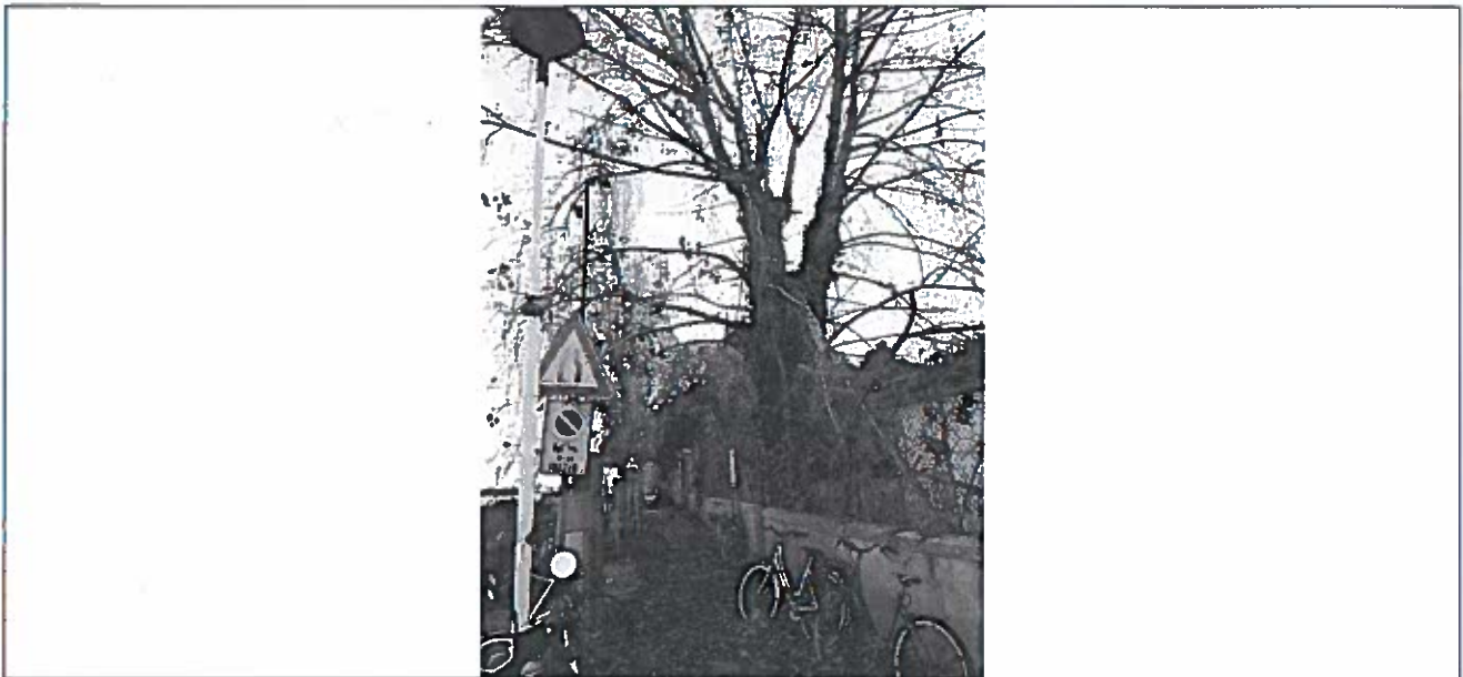
Foto 4 – esemplare arboreo lungo Riviera San Nicolò con branche staccate dopo il fortunale