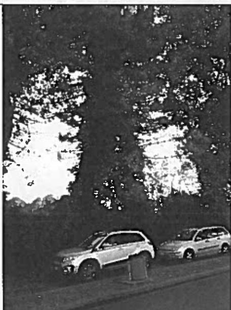
Foto 3 – pini marittimi posti in prossimità della biglietteria e prospicienti la corsia d'imbarco la ferry boat