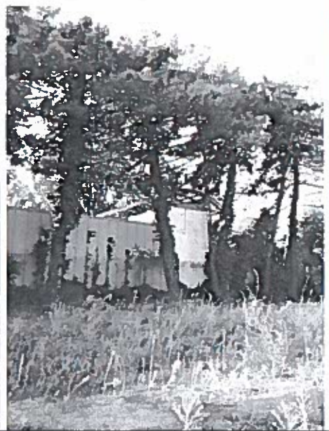
Foto 5 – pini marittimi che sovrastano la copertura della biglietteria