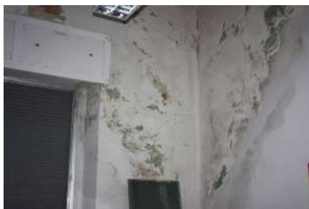
Patologie di degrado