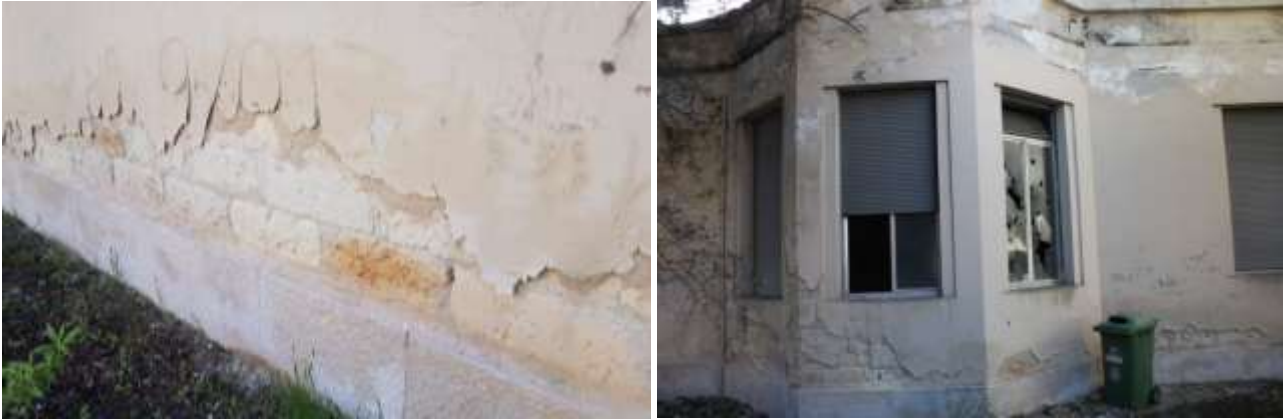
Viste prospetto Nord

Dal punto di vista strutturale le caratteristiche principali del Padiglione, edificato tra il 1936 e il 1940, sono risultate le seguenti: