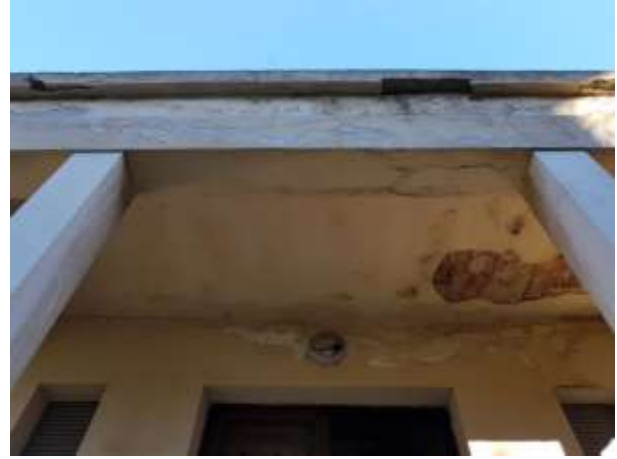
Patologie di degrado del pronao