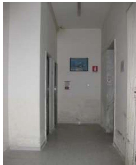
Patologie di degrado