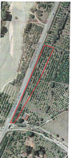
Representazione grafica indicativa del bene oggetto di avviso

Descrizione: Terreno di forma rettangolare con giacitura pianeggiante coltivato avente una superficie complessiva di mq. 2620 censito tra i beni patrimoniali dello Stato alla scheda RCB0704 e posto lungo la sponda sinistra della Fiumara Bruzzano. E' identificato al Catasto Terreni del Comune di Bruzzano al Fg. 24 p.lle 63 e 64. Occupato con contratto di locazione scaduto in data 31/07/2009.