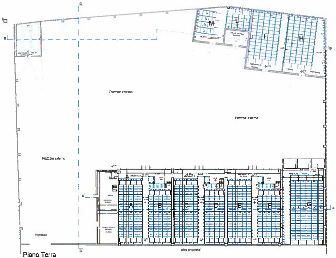
Pianta piano terra

Il progetto prevede la ristrutturazione e ri-funzionalizzazione di tutti i fabbricati ivi presenti ad eccezione delle strutture più precarie che verranno demolite: