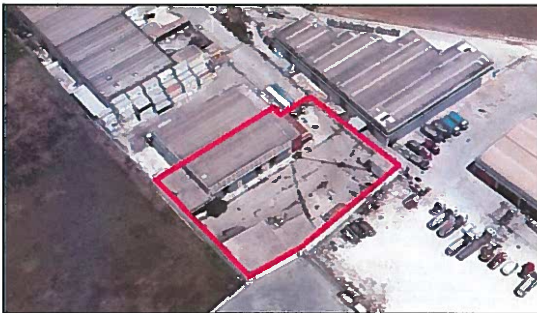
Ortofoto - individuazione delle compendio

L'Agenzia del demanio, nell'ambito dei propri programmi di razionalizzazione degli immobili pubblici, sta avviando la procedura per l'affidamento dei servizi di ingegneria afferenti ai lavori di ristrutturazione e ri-funzionalizzazione dell'ex capannone confiscato sito nel Comune di Brindisi in contrada Piccoli, da destinare a sede degli archivi del MIBACT.