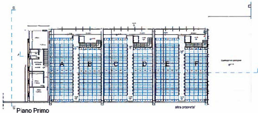
Pianta piano primo