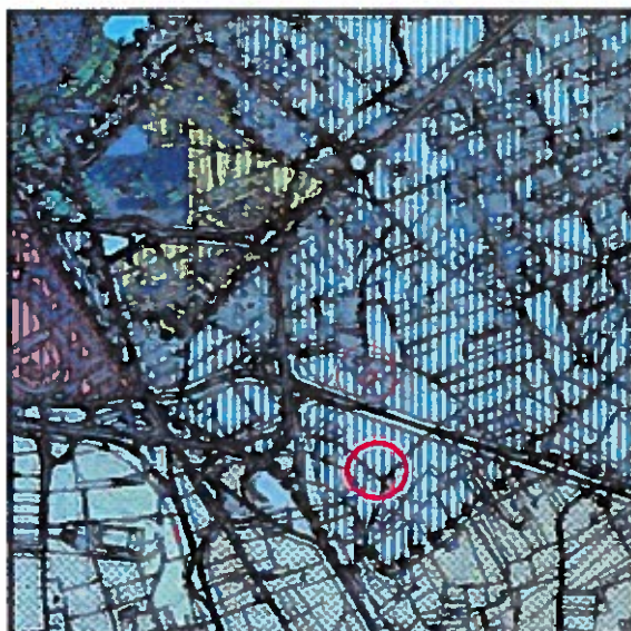
Stralcio del PRG - Scala 1:10.000

Il capannone in oggetto è situato in una zona con destinazione urbanistica D/3 produttiva Industriale, così come individuata nel PRG del Comune di Brindisi