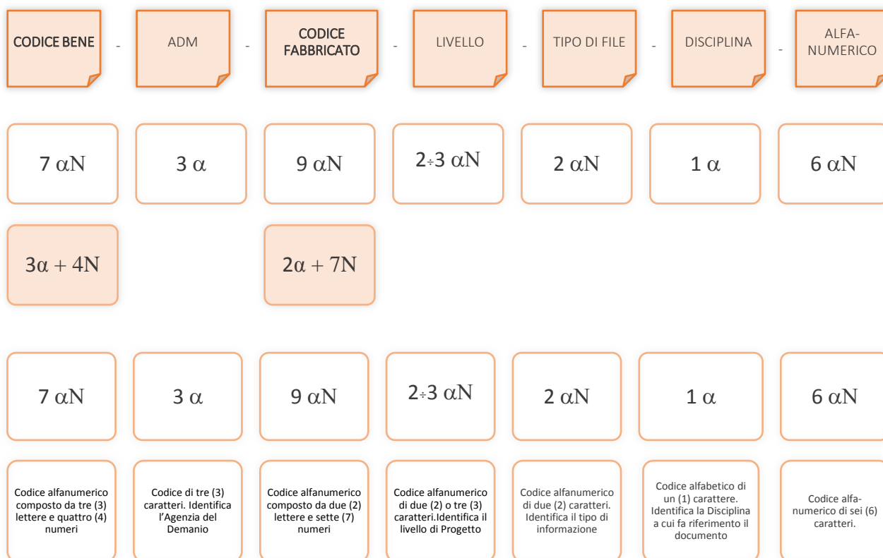
Esempio di codifica dei modelli

Di seguito è riportata lo schema tipico della codifica su citata a titolo esemplificativo e non esaustivo: