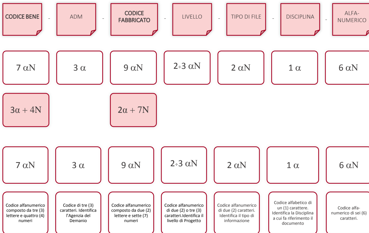
Esempio di codifica dei modelli

Di seguito è riportata lo schema tipico della codifica su citata a titolo esemplificativo e non esaustivo: