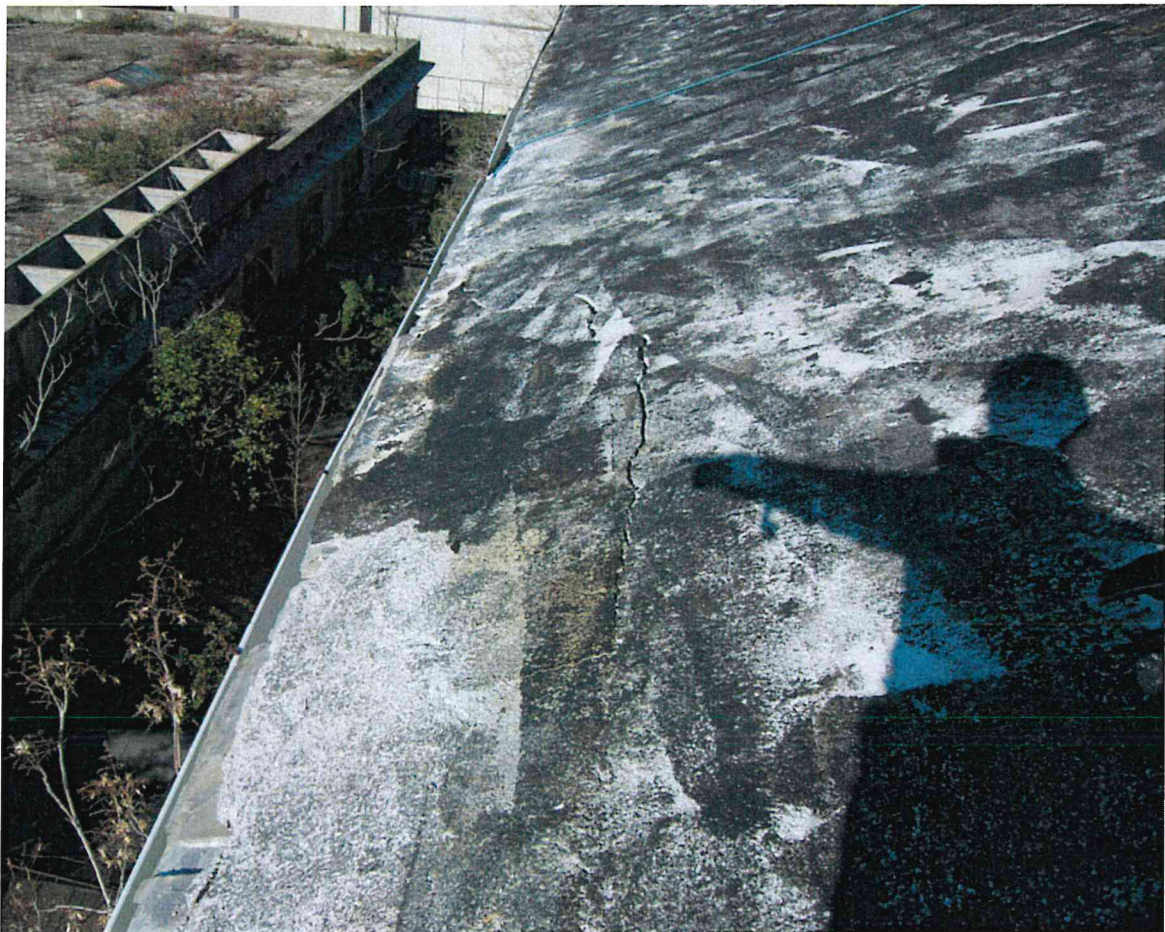
Fig. 6 – Particolare falda a Sud vista da Est