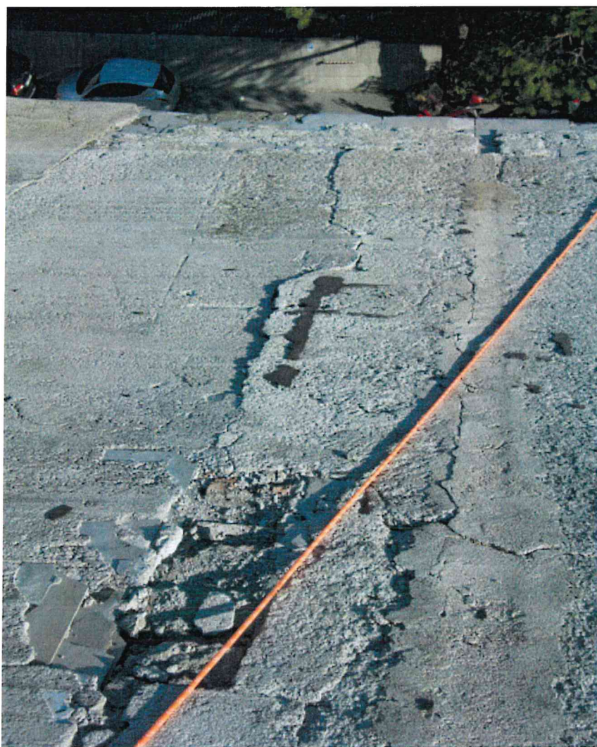
Fig. 2 – Falda a Nord vista da Sud