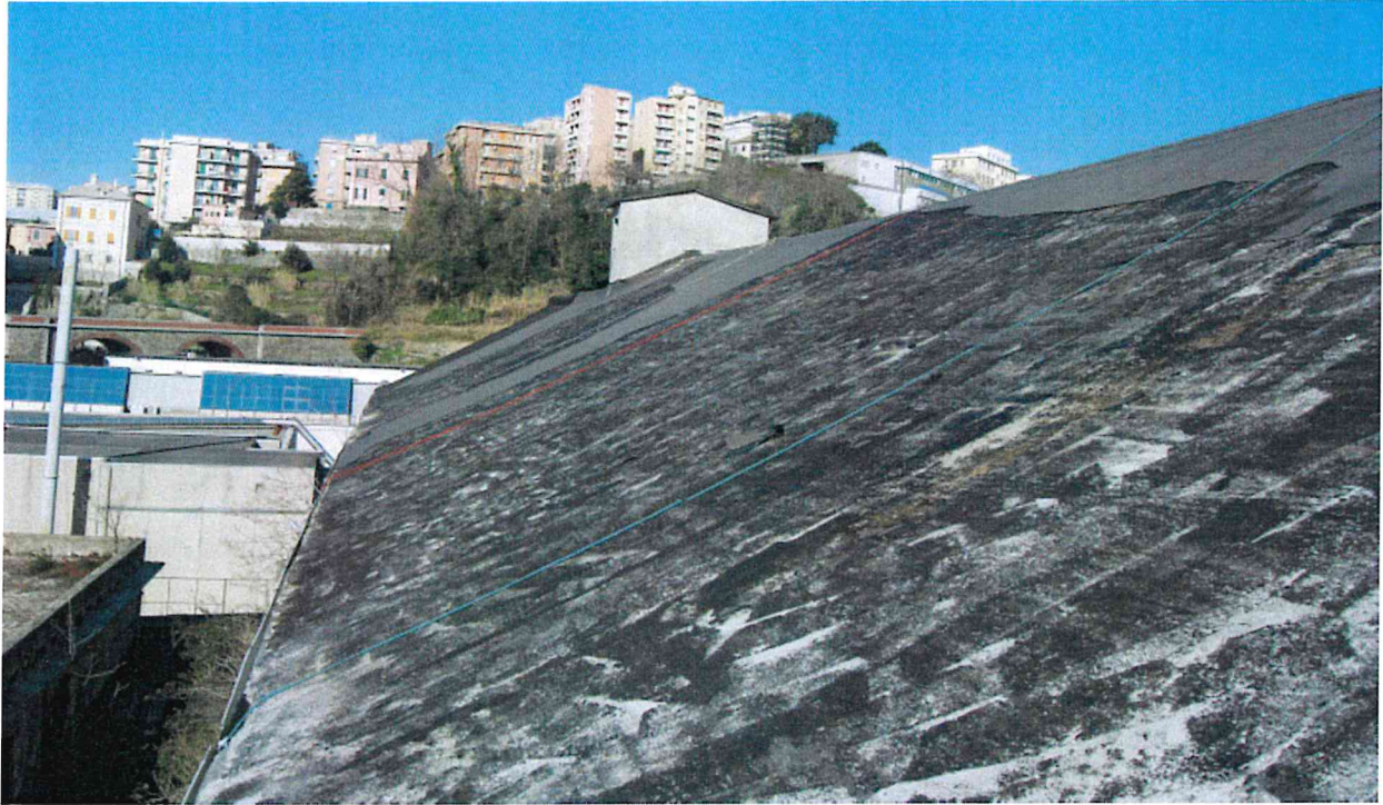
Fig. 5 – Falda a Sud vista da Est