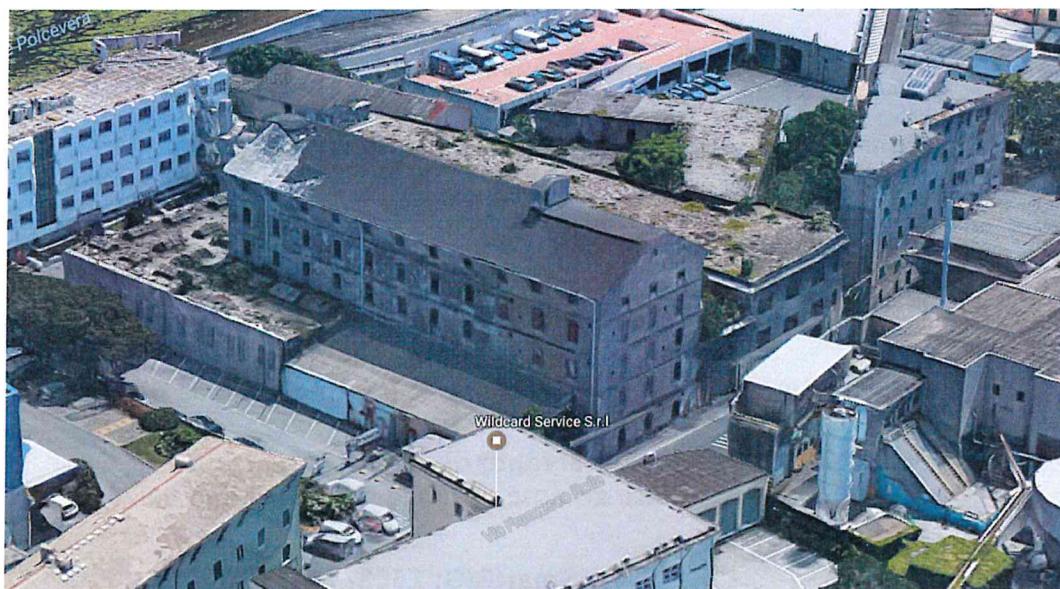
Fig. 1 – Vista aerea del Compendio immobiliare “ex Caserma Marabotto” – Via Rolla, 9 – Genova