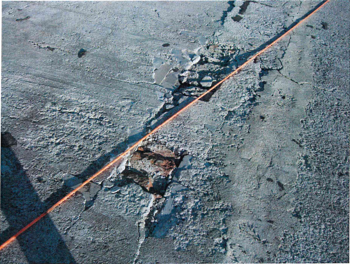
Fig. 3 – Particolare falda a Nord vista da Sud