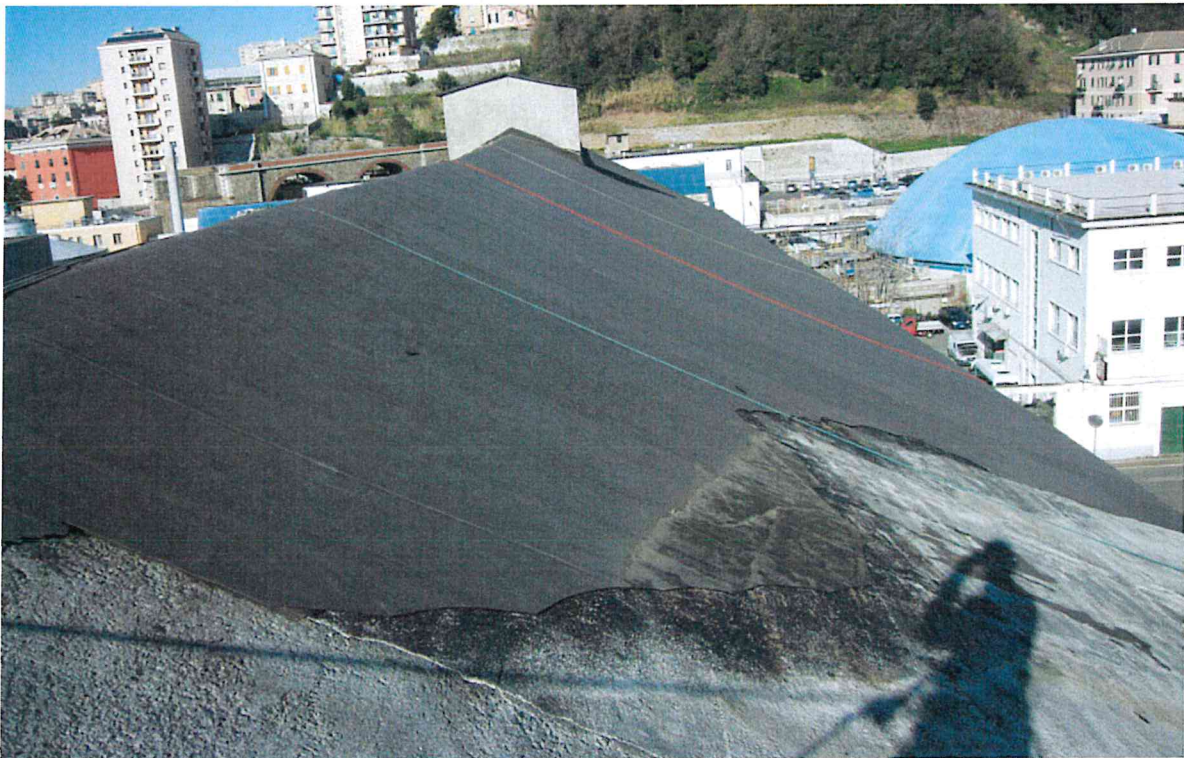
Fig. 4 – Falda a Nord vista da Est