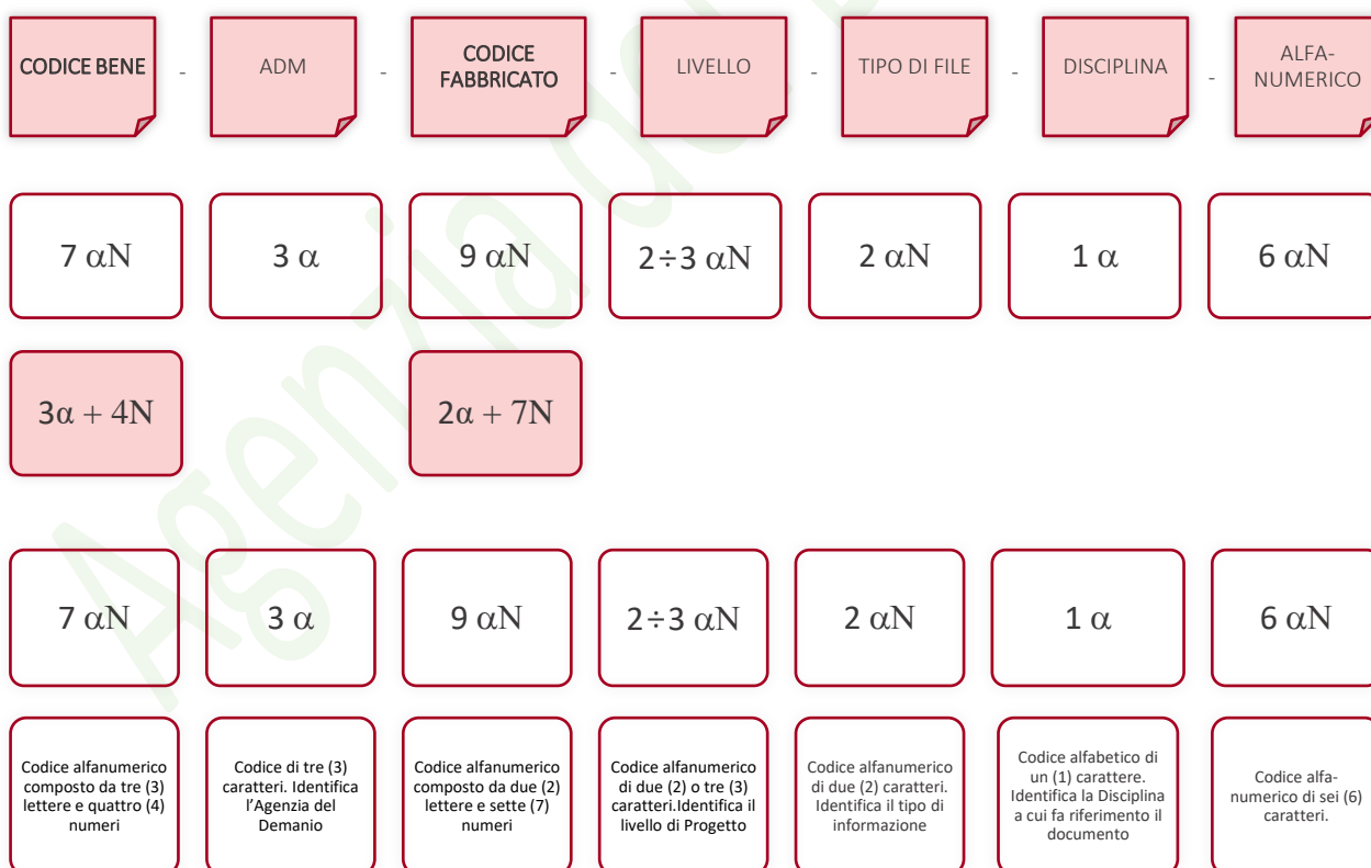
Esempio di codifica dei modelli

Di seguito è riportata lo schema tipico della codifica su citata a titolo esemplificativo e non esaustivo: