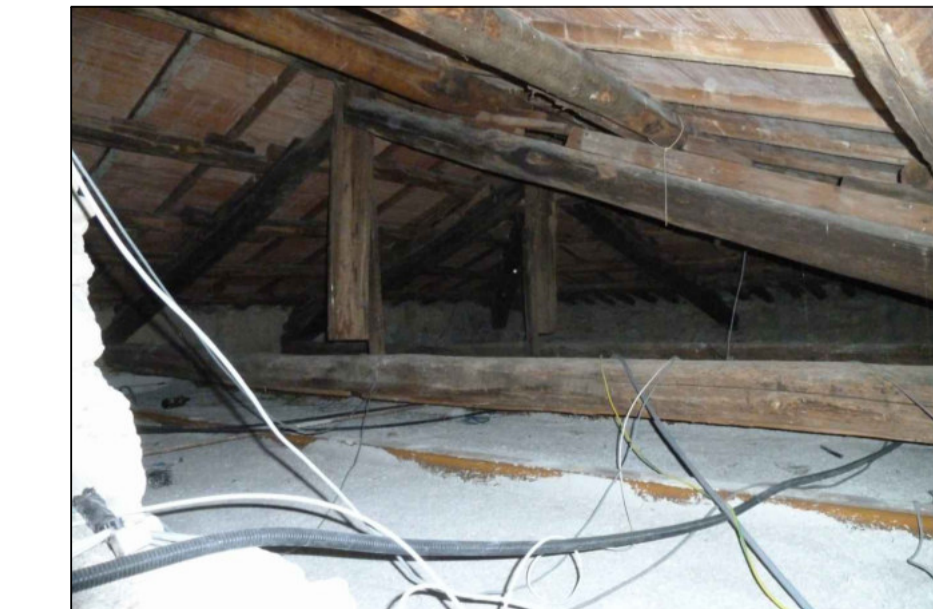
11 - STRUTTURA TERMINALE DELL'ALA NORD-EST