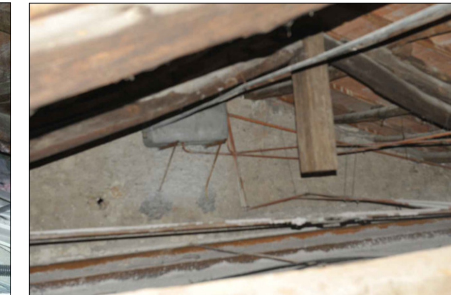
10 - CAPRIATA CON CATENA IN FERRO TONDO