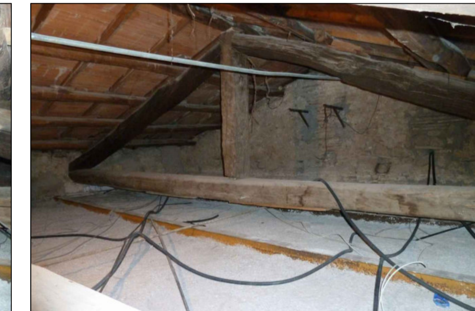
12 - CAPRIATA