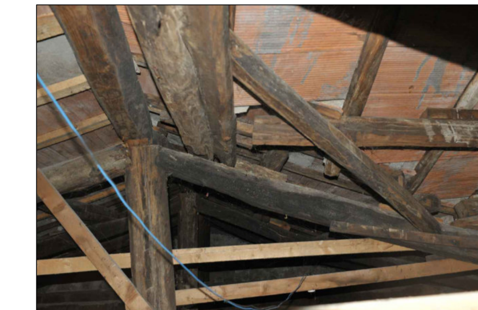
1 - GEOMETRIE IRREGOLARI DELLE TRAVATURE