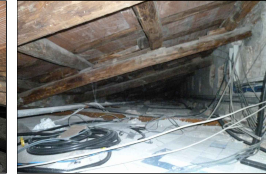
8 - SOTTOTETTO CORRIDOIO