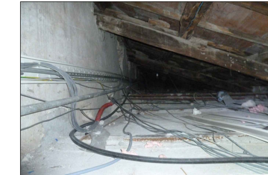
9 - SOTTOTETTO CORRIDOIO