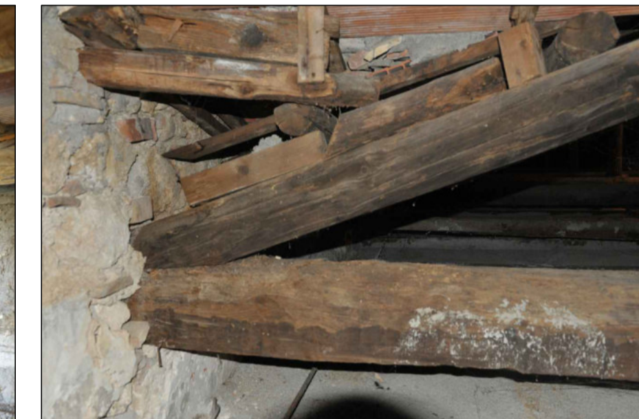
4 - CAPRIATA CON SOPRASTANTE TESSITURA DEL TIMPANO