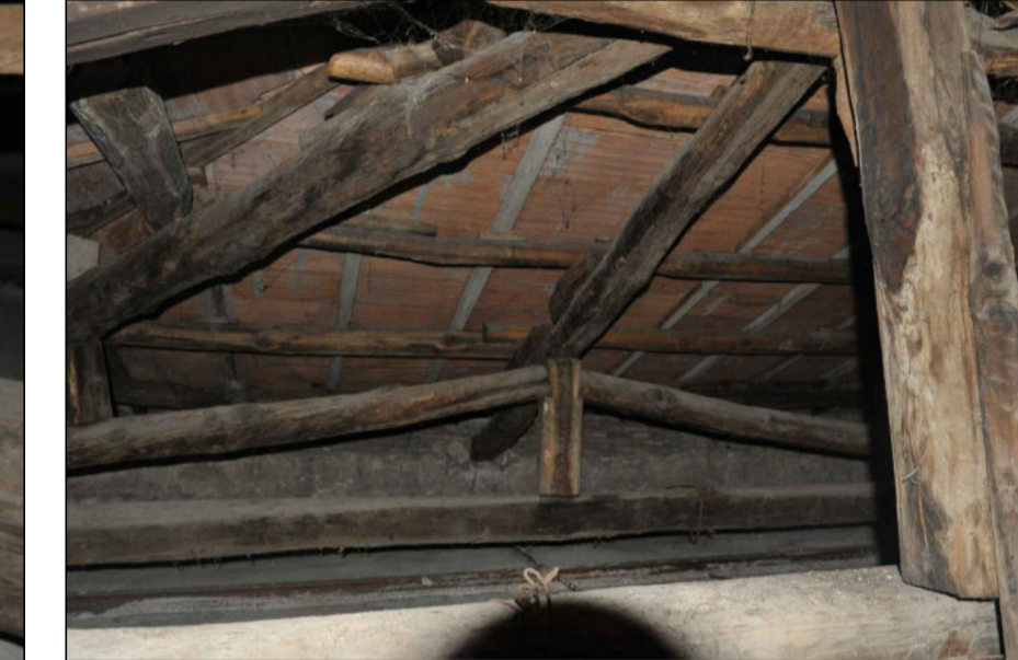
6 - STRUTTURA FALDA TERMINALE