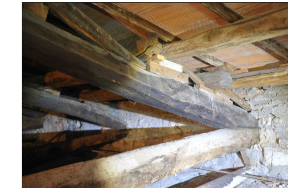
3 - CAPRIATA E ARCARECCI