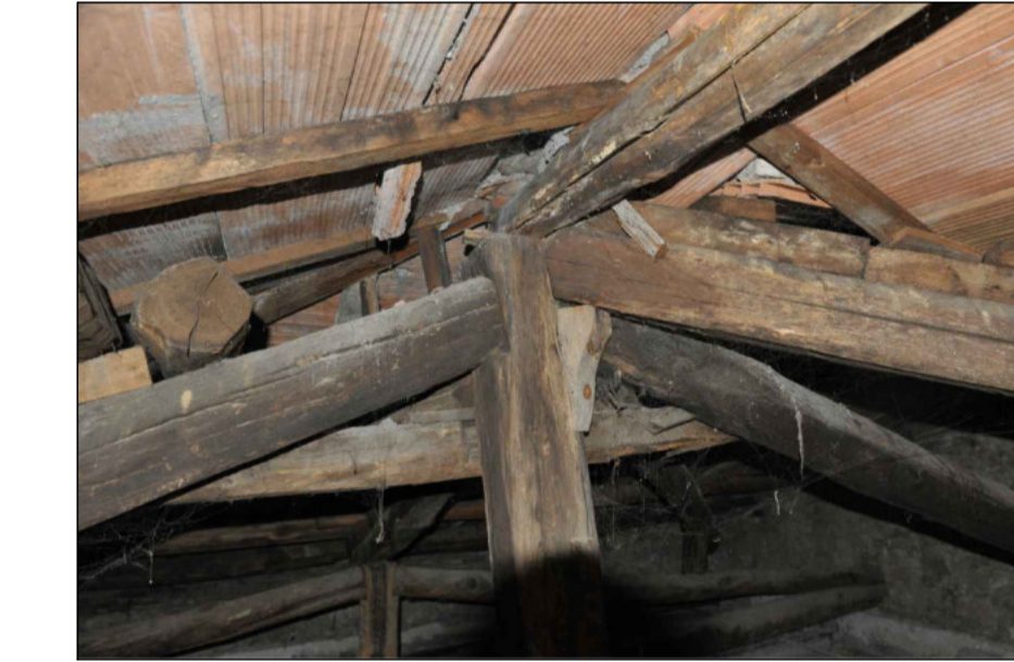
7 - NODO TRAVI DI COLMO