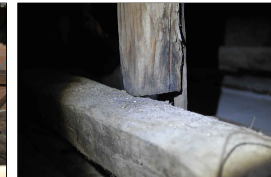
2 - MONACO E CATENA