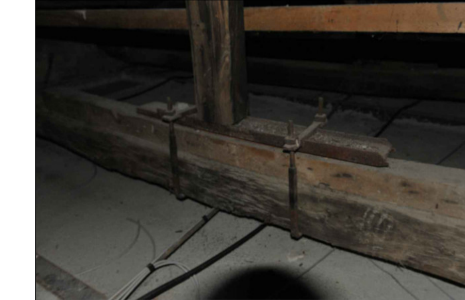
5 - NODO CATENA-MONACO