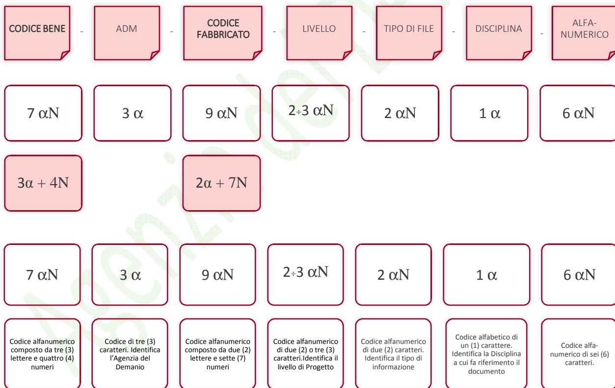
Esempio di codifica dei modelli

Di seguito è riportata lo schema tipico della codifica su citata a titolo esemplificativo e non esaustivo: