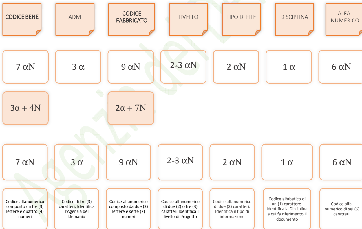
Esempio di codifica dei modelli

Di seguito è riportata lo schema tipico della codifica su citata a titolo esemplificativo e non esaustivo: