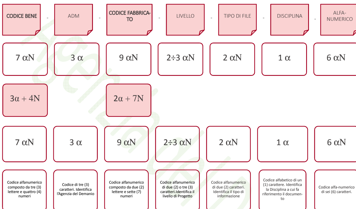
Esempio di codifica dei modelli

Di seguito è riportata lo schema tipico della codifica su citata a titolo esemplificativo e non esaustivo: