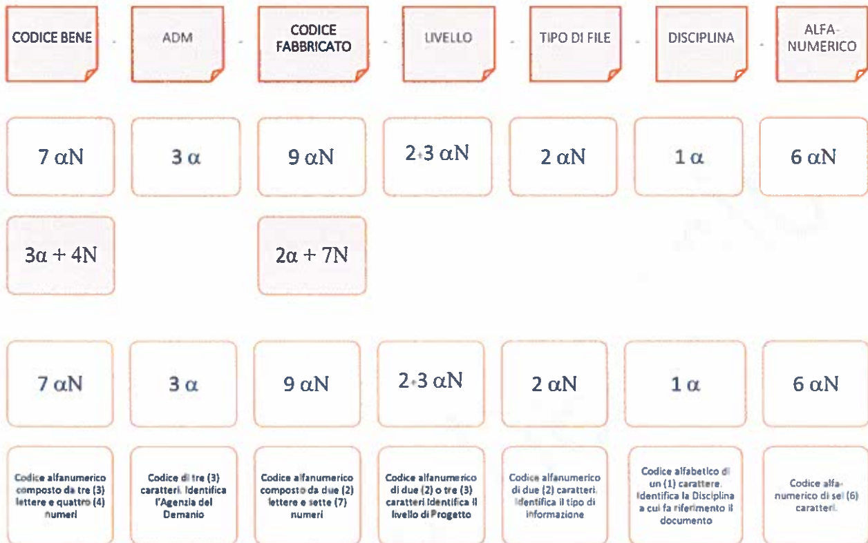
Esempio di codifica dei modelli

Di seguito è riportata lo schema tipico della codifica su citata a titolo esemplificativo e non esaustivo: