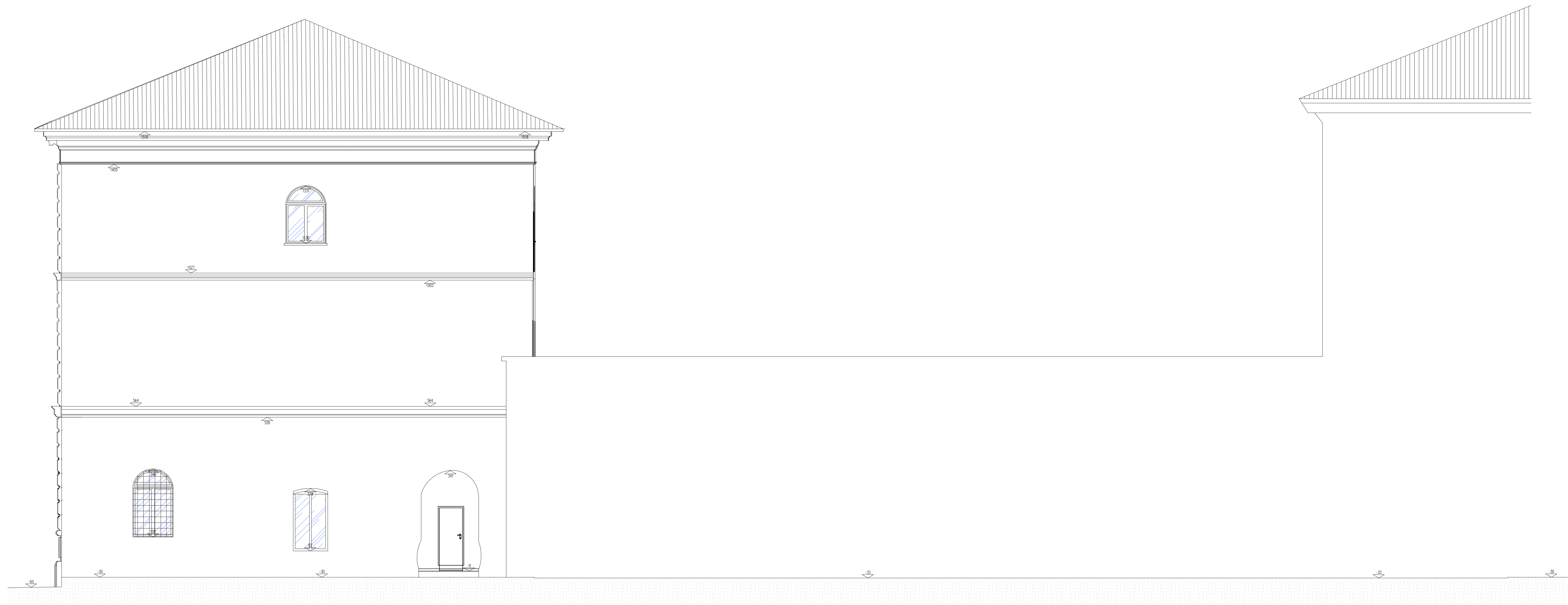
2 PROSPETTO LATERALE AR07 SCALA 1:50