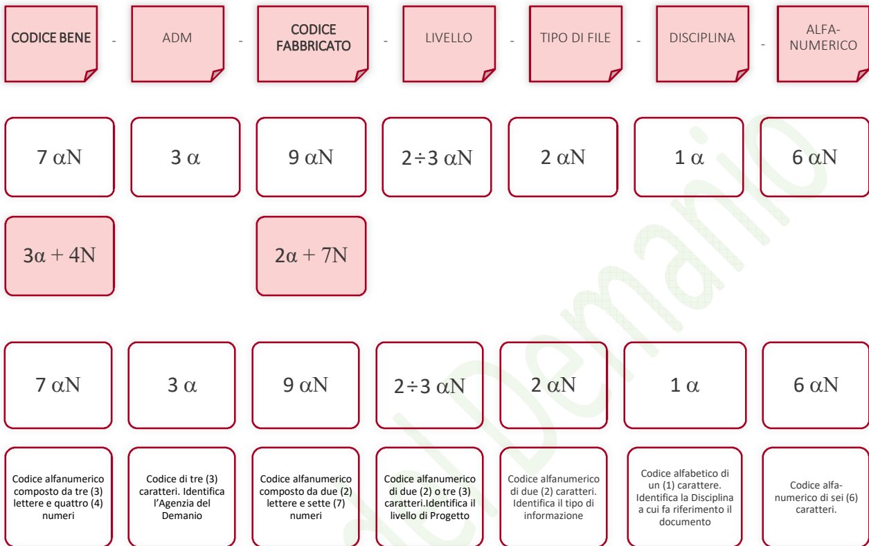
Esempio di codifica dei modelli

Di seguito è riportata lo schema tipico della codifica su citata a titolo esemplificativo e non esaustivo: