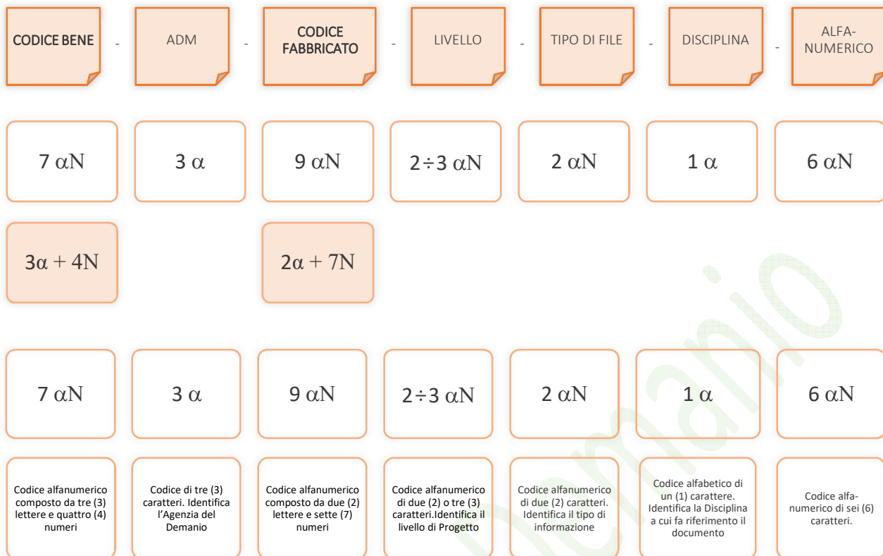
Esempio di codifica dei modelli