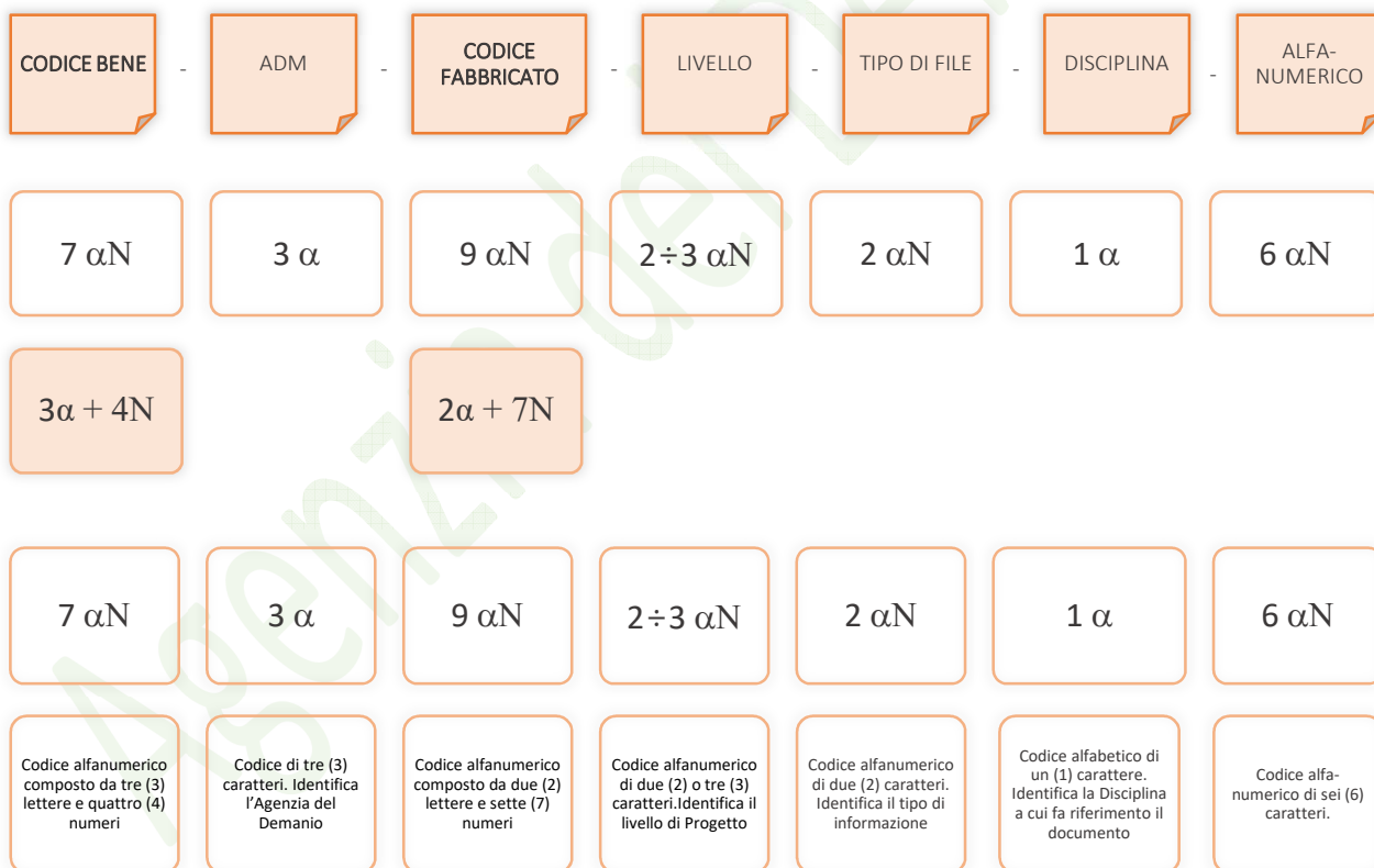
Esempio di codifica dei modelli

Di seguito è riportata lo schema tipico della codifica su citata a titolo esemplificativo e non esaustivo: