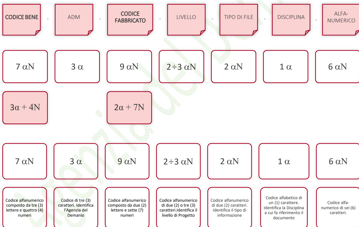
Esempio di codifica dei modelli

Di seguito è riportata lo schema tipico della codifica su citata a titolo esemplificativo e non esaustivo: