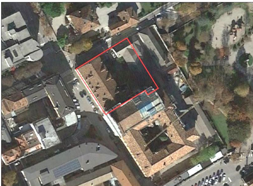
Orto-foto con indicazione dell'immobile oggetto di intervento

Per fornire al concorrente le prime indicazioni sulla tipologia e sullo sviluppo plano-volumetrico dell'immobile, viene di seguito allegata un'orto-foto del compendio e l'estratto mappa catastale. Per una dettagliata descrizione del servizio da svolgere si rimanda ai paragrafi successivi del presente Capitolato Tecnico , al Progetto di Fattibilità Tecnico Economica , alle attività di rilievo, di vulnerabilità sismica, di diagnosi energetica, alle indagini stratigrafiche e ambientali eseguite sul compendio e ad un primo studio di miglioramento/adeguamento sismico.