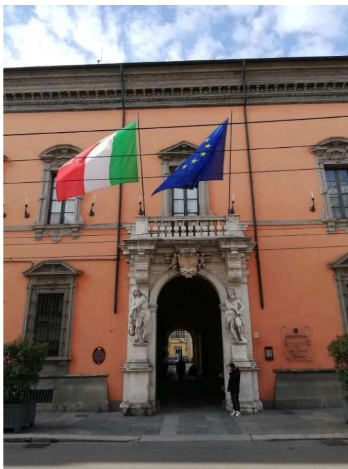
Fig. 6 – Ingresso Str. Repubblica