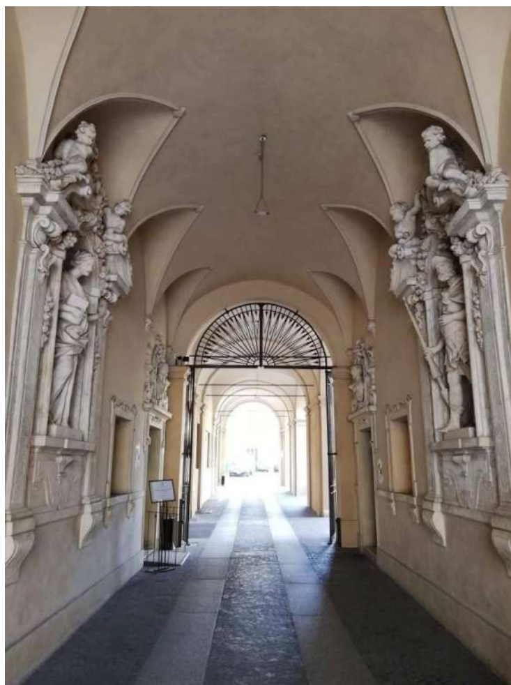
Fig. 7 – Androne di ingresso