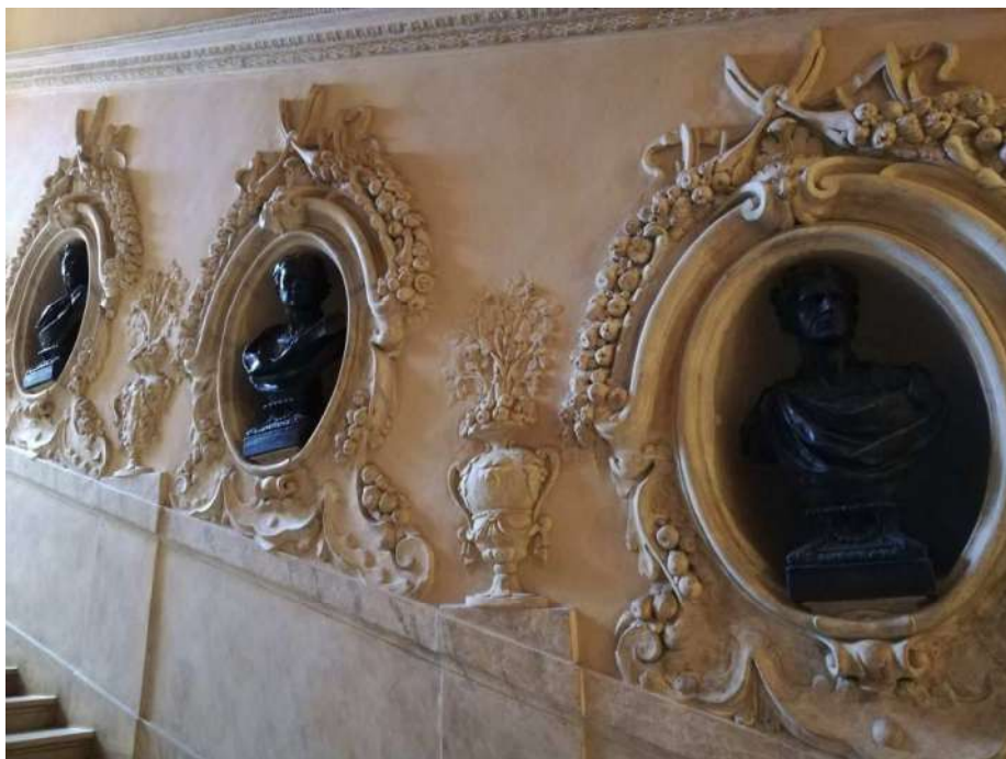
Fig. 12 – Stucchi scalone principale (Corpo C)