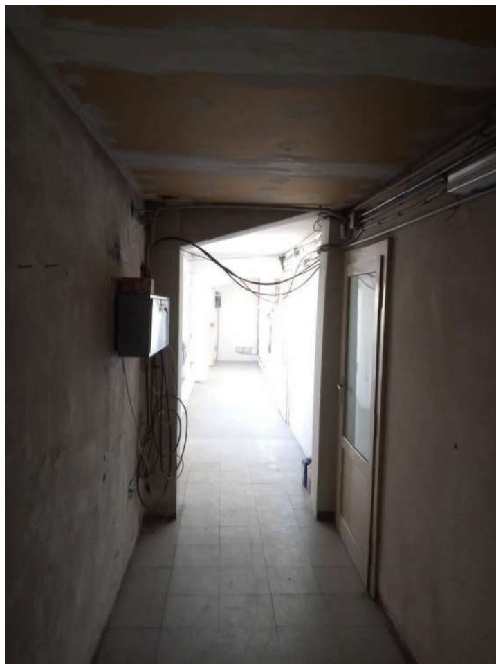
Fig. 19 – Piano terzo-sottotetto (Corpo A)