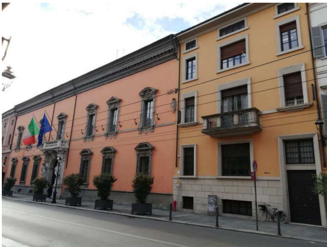
Fig. 5 – Prospetto nord Str. Repubblica