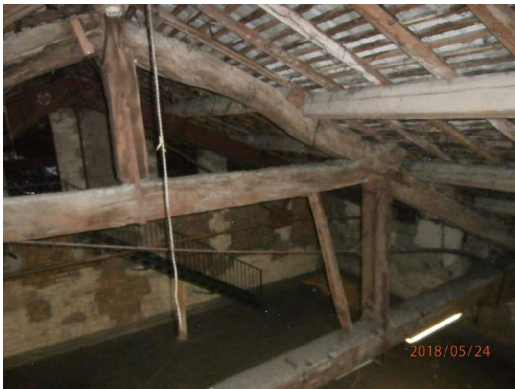
Fig. 23 – Sottotetto (Corpo B-C)