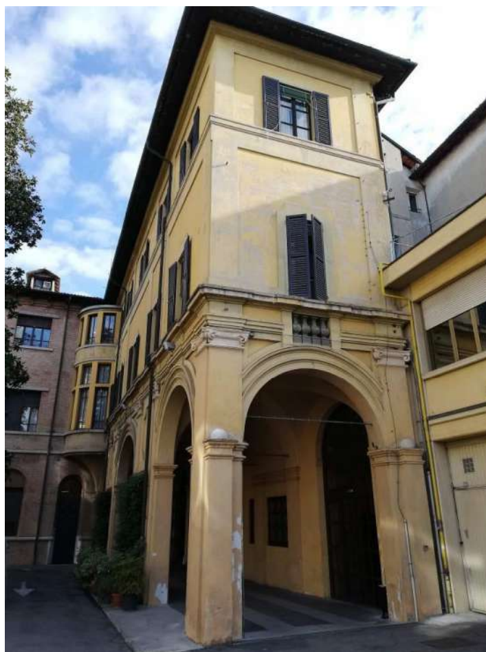
Fig. 9 – Cortile interno (Corpo C)