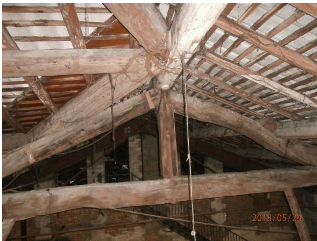
Fig. 21 – Sottotetto (Corpo B-C)