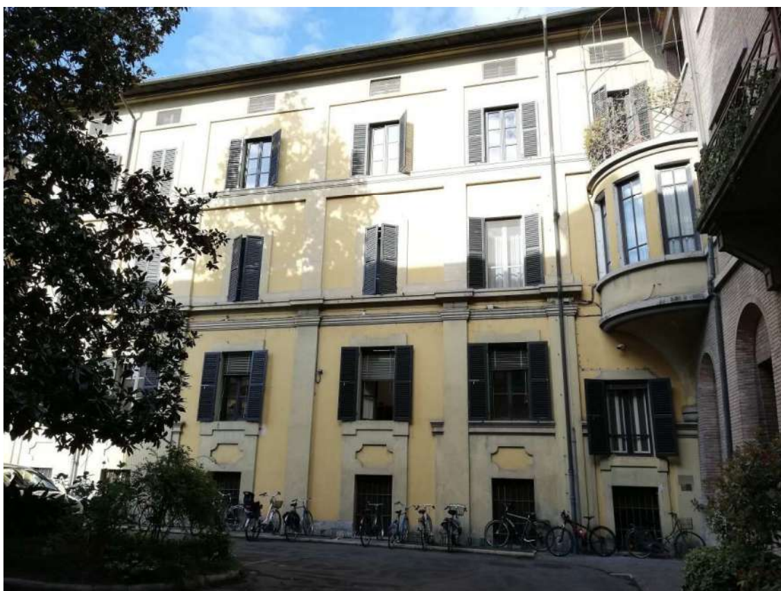
Fig. 10 – Cortile interno (Corpo A)