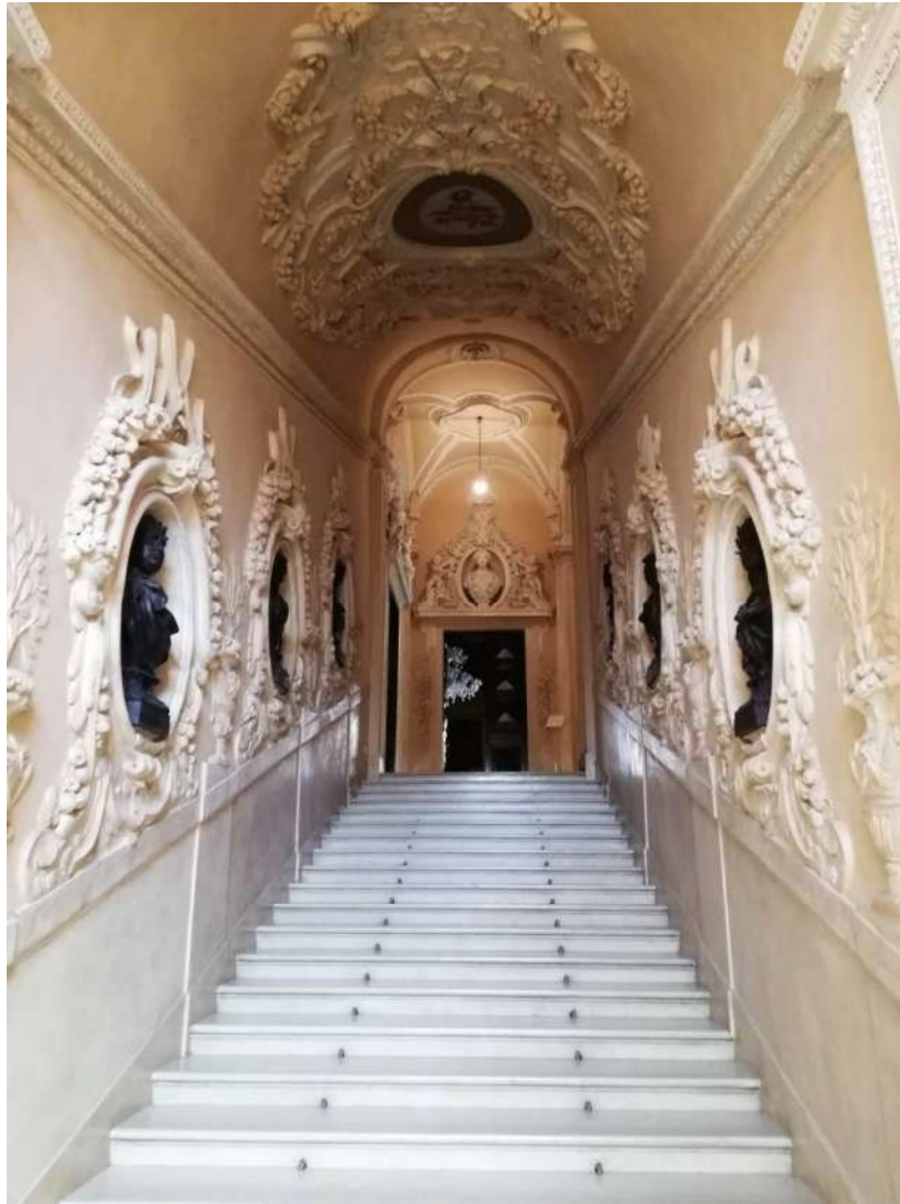
Fig. 11 – Scalone principale al piano nobile (Corpo C)