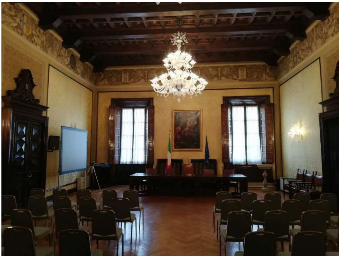
Fig. 13 – Salone prefettizio piano primo (Corpo C)