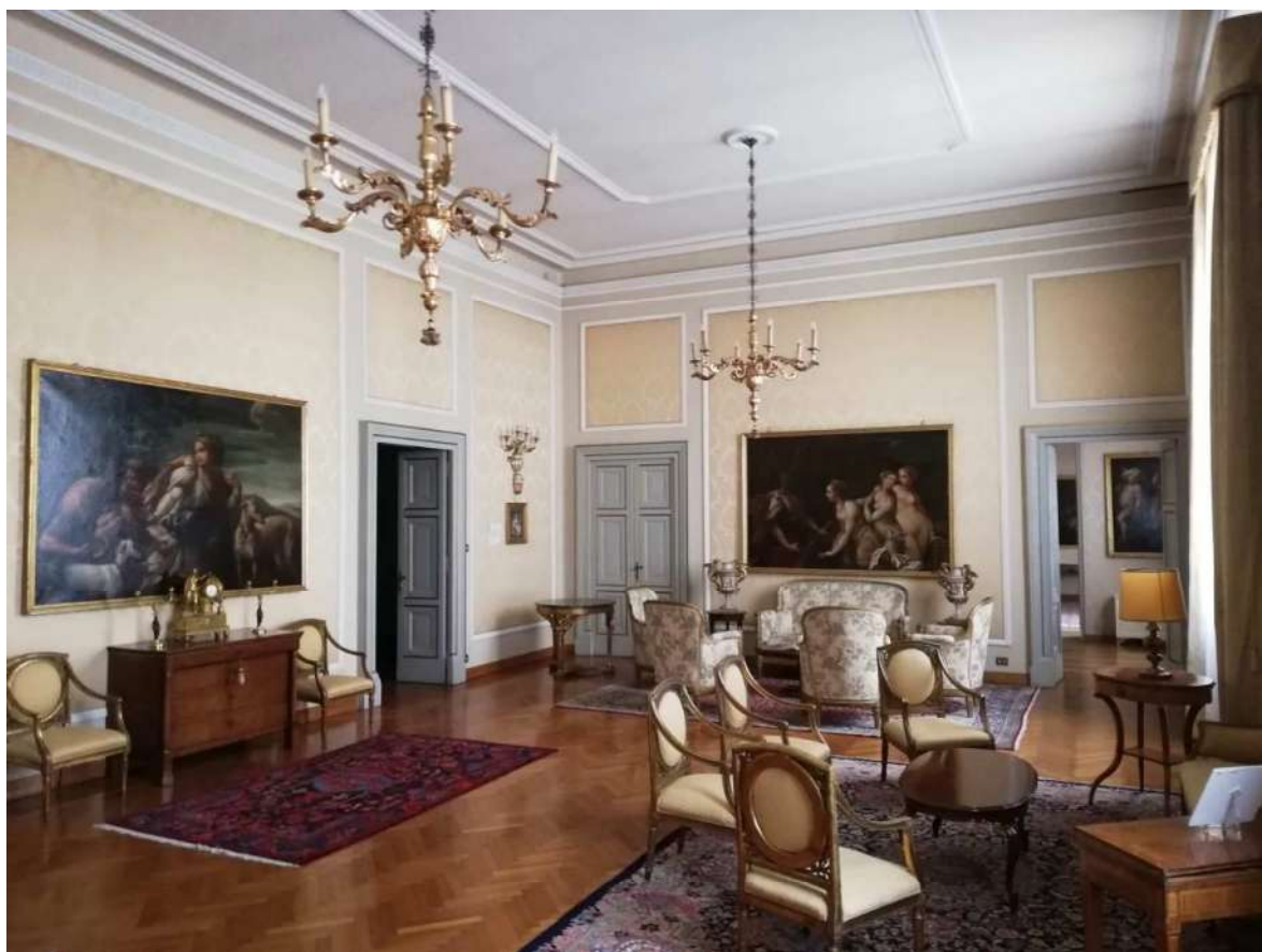
Fig. 14 – Salotto di rappresentanza piano primo (Corpo B)