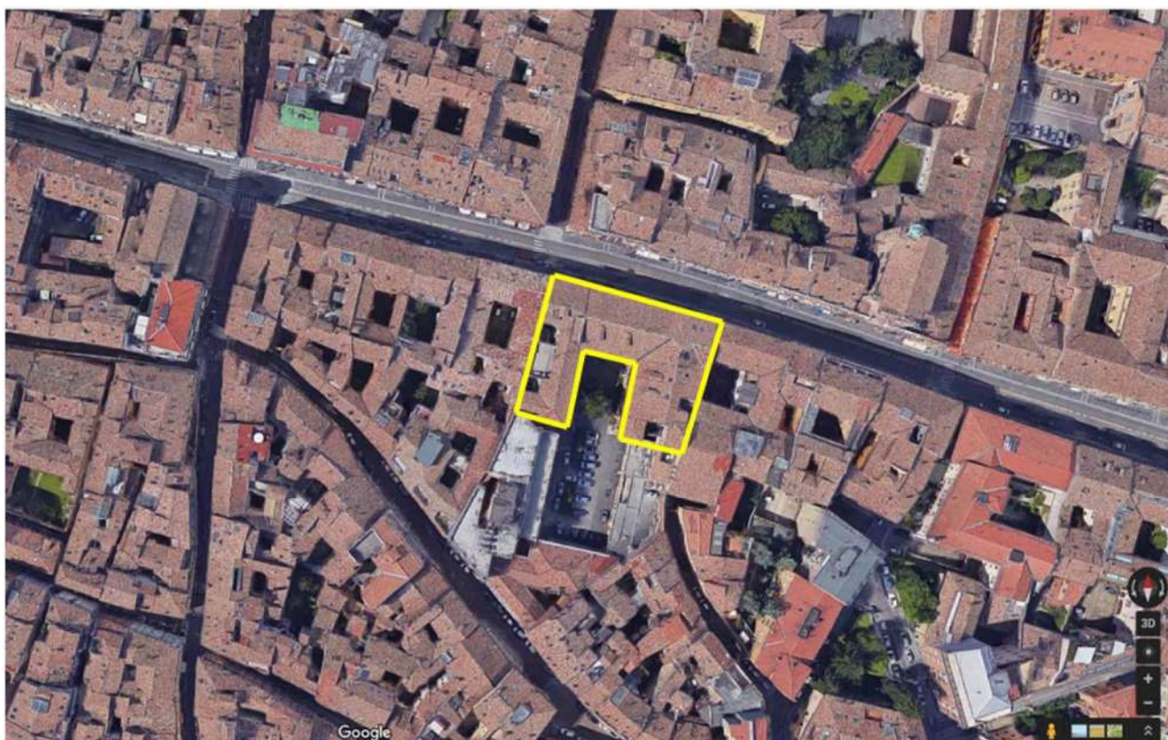
Fig. 1 – Foto aerea