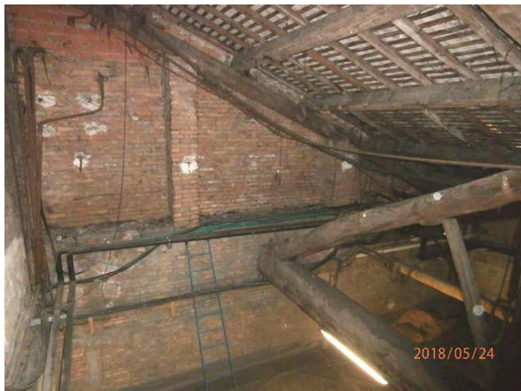
Fig. 22 – Sottotetto (Corpo B-C)