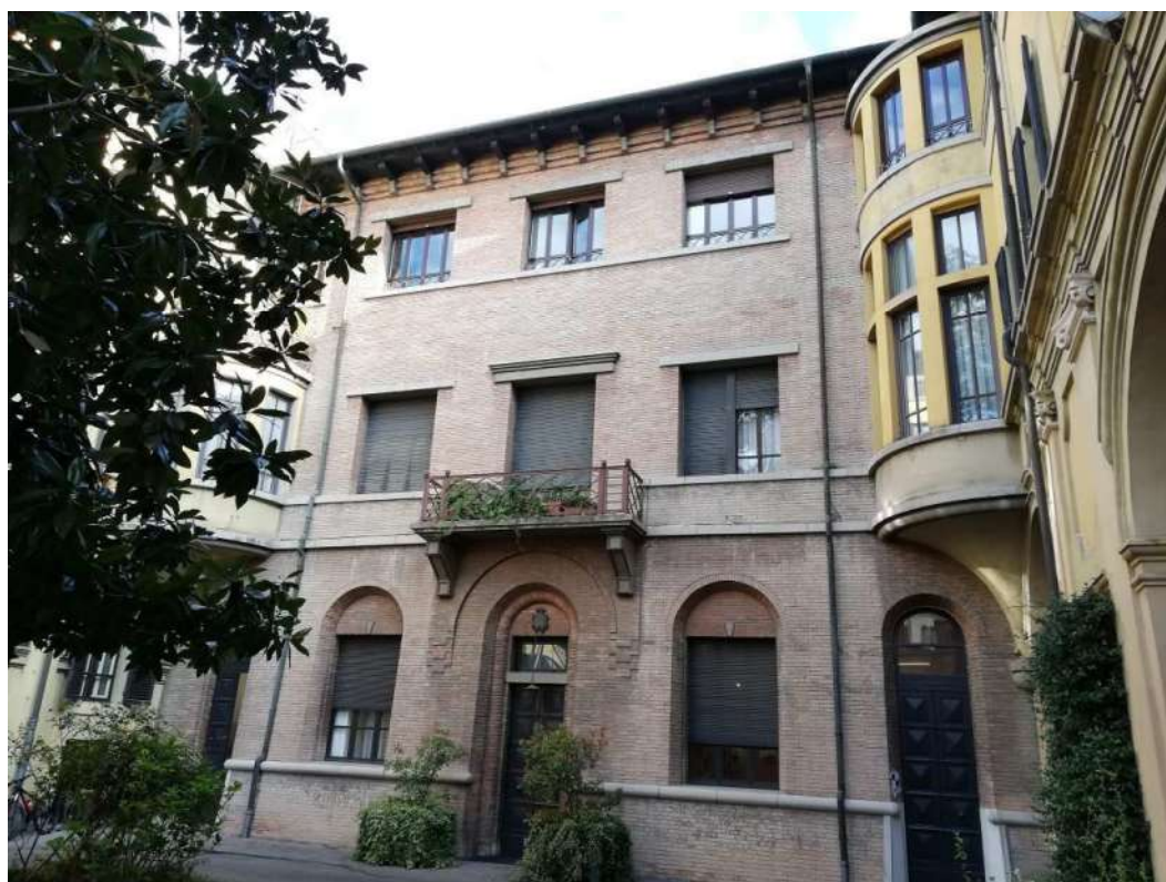
Fig. 8 – Cortile interno (Corpo B)