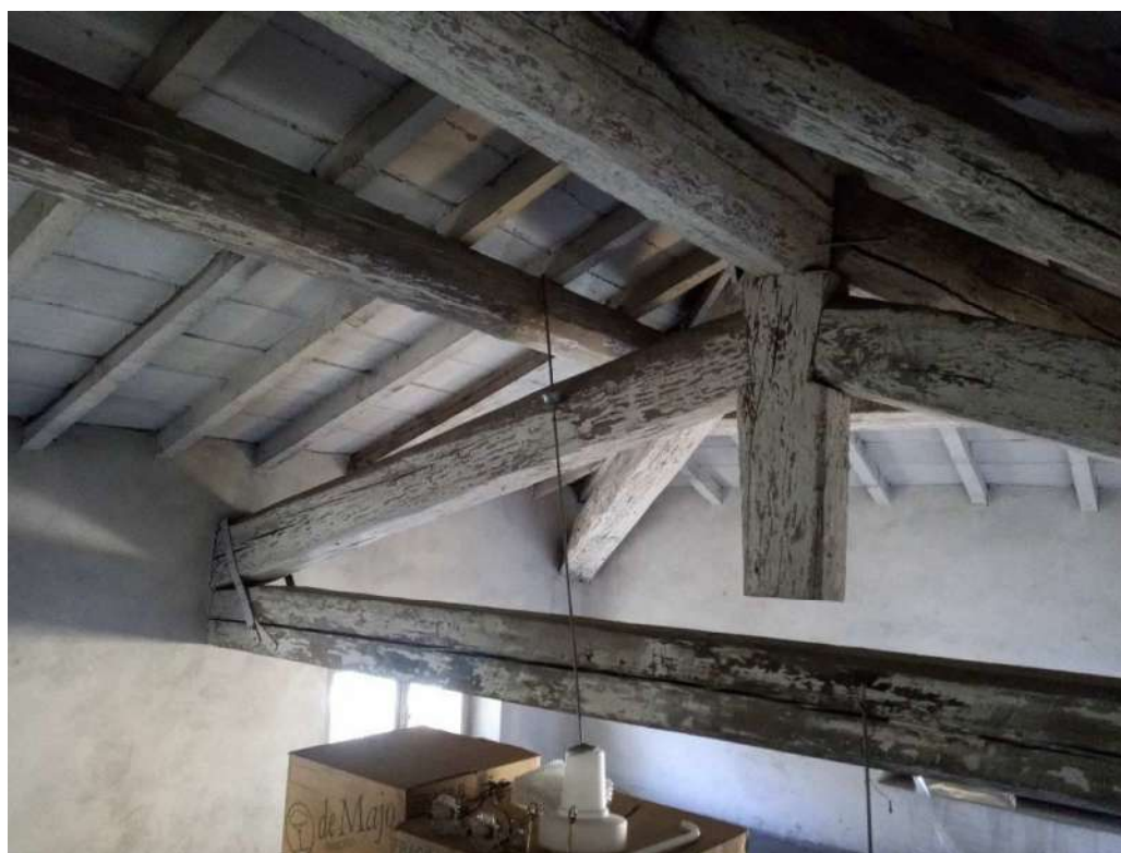
Fig. 20 – Piano terzo-sottotetto (Corpo A)