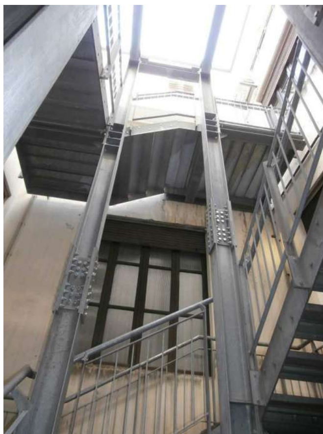
Fig. 24 – Scala esterna (Corpo A)