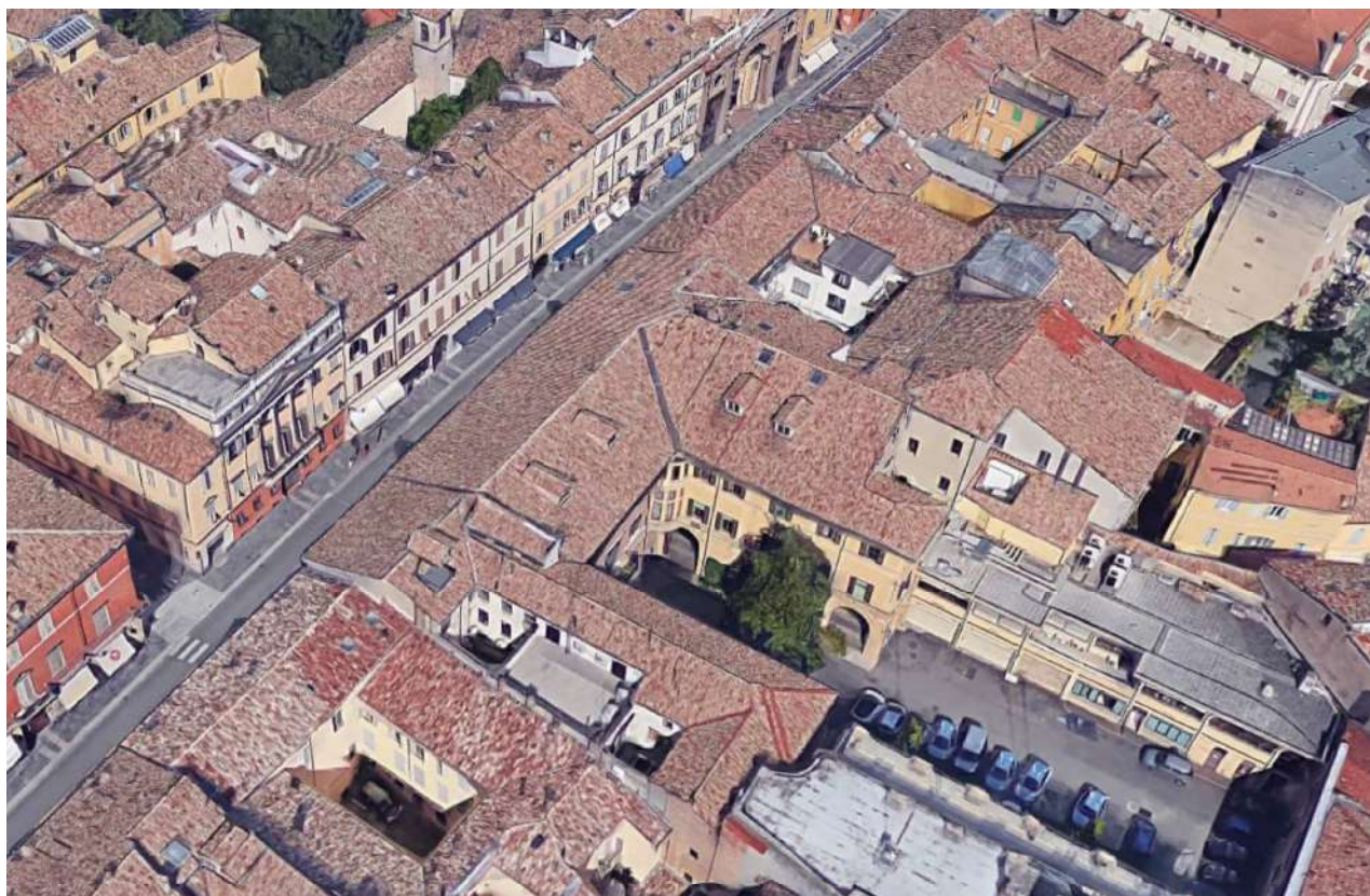
Fig. 3 – Foto aerea