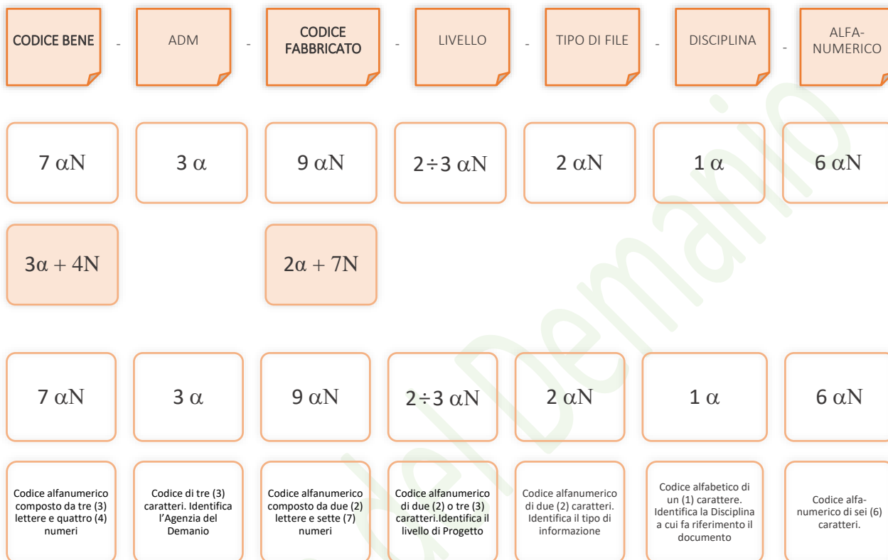
Esempio di codifica dei modelli

Di seguito è riportata lo schema tipico della codifica su citata a titolo esemplificativo e non esaustivo: