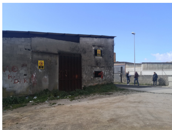
Figura 4: Fronte prospiciente area Demanio Marittimo