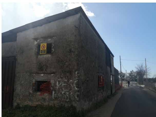
Figura 3: Vista d'insieme del manufatto