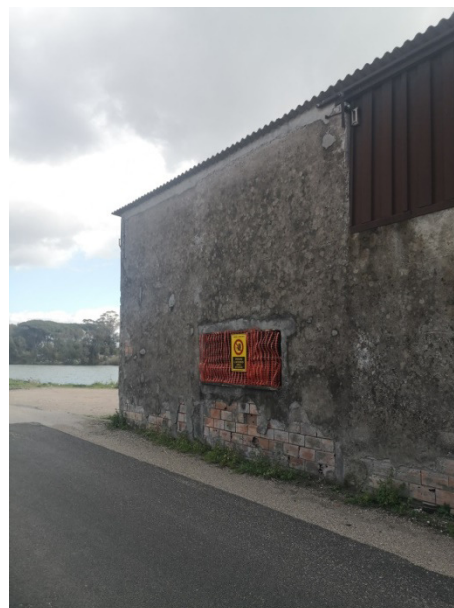
Figura 2: Fronte del manufatto su strada