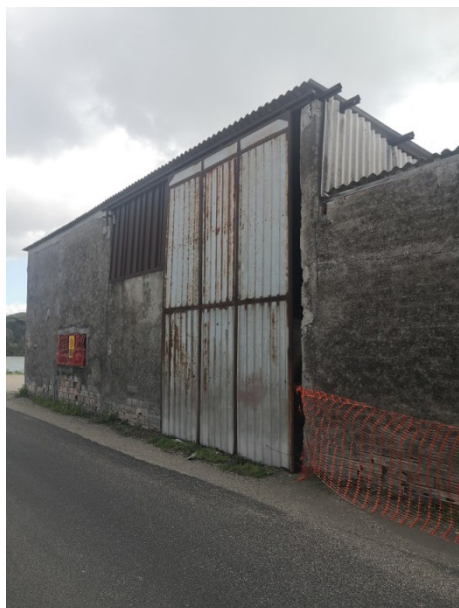
Figura 1: Fronte del manufatto su strada