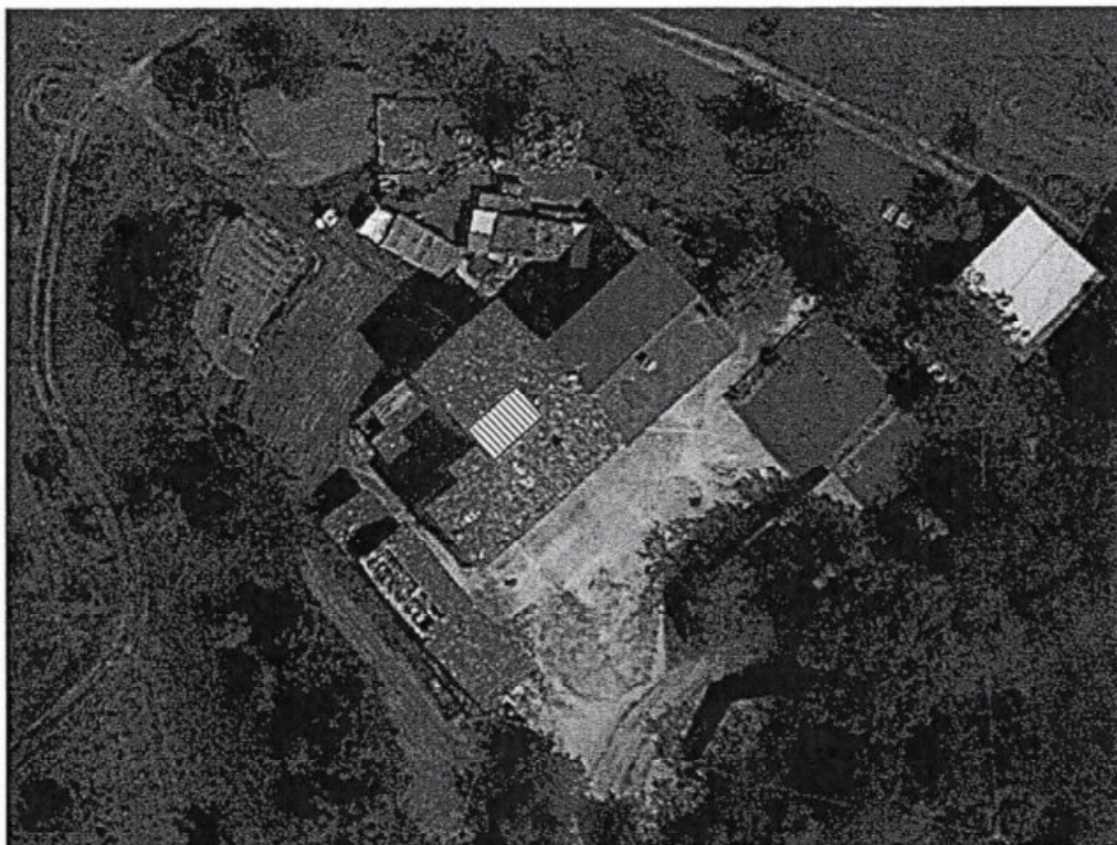
Vista area e individuazione porzione tetto crollato