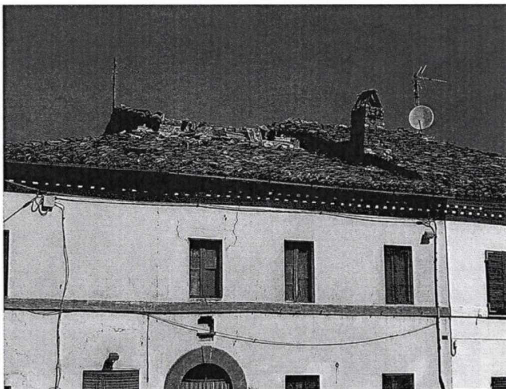
Foto 1. Vista del tetto fronte Strada Contrada Bore

TRAVAGLINI COSTRUZIONI SRL Via della Conca (260ma) n° 48 63100 ASCOLI PICENO Tel. 0736 306030 - Fax 0736 306000 P. IVA 02314280443 - CCIAA AP-204480 email: info@travaglinicostruzioni.it