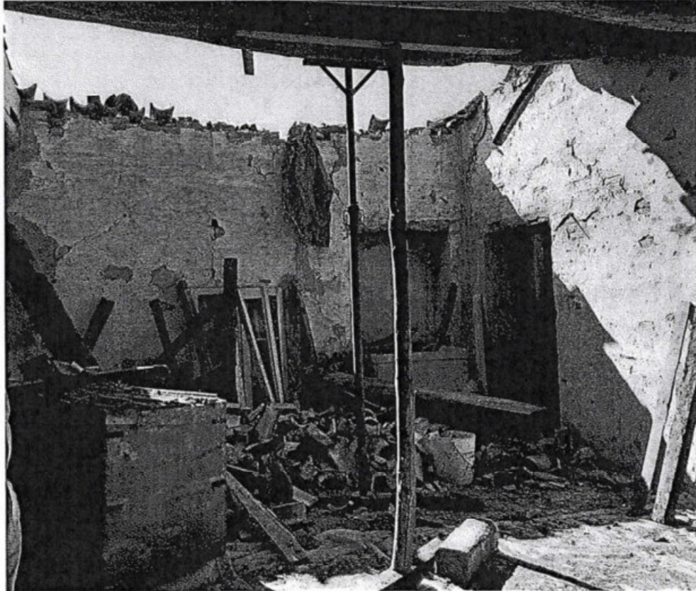
Foto 3. Vista sul materiale di risulta prodotti dal crollo

TRAVAGLINI COSTRUZIONI SRL Via della Conca (260ma) n° 48 63100 ASCOLI PICENO Tel. 0736 306030 Fax 0736 306000 P. IVA 02314280443 CCIAA AP-204480 email: info@travaglinicostruzioni.it