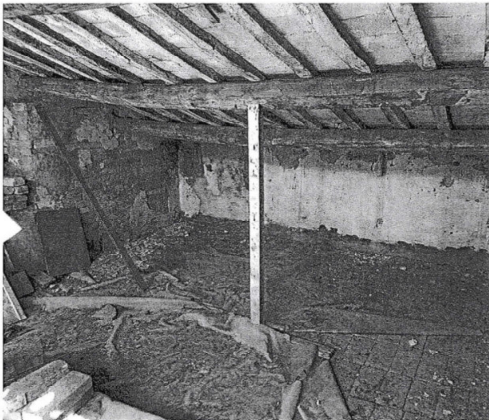
Foto 4. Vista sulla porzione rimanente di copertura

TRAVAGLINI COSTRUZIONI SRL Via della Conca (260ma) n° 48 63100 ASCOLI PICENO Tel. 0736 306030 / Fax 0736 306000 P. IVA 02314280423 \ CCIAA AP-204480 email: info@travaglinicostruzioni.it