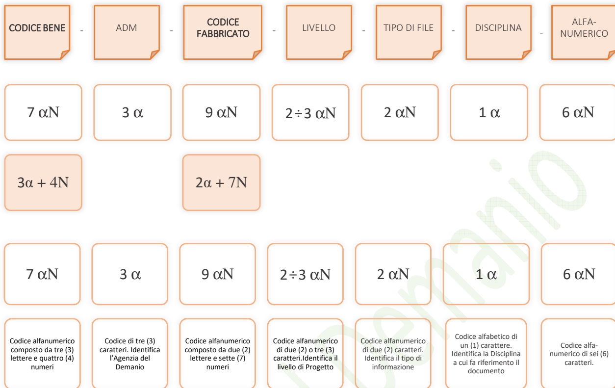
Esempio di codifica dei modelli