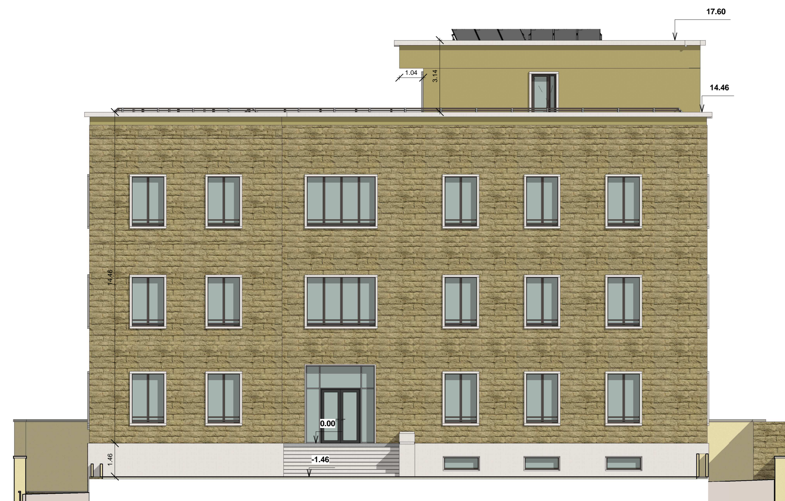
A_S-O_Progetto Prosp. Sud-Ovest Scala 1:100