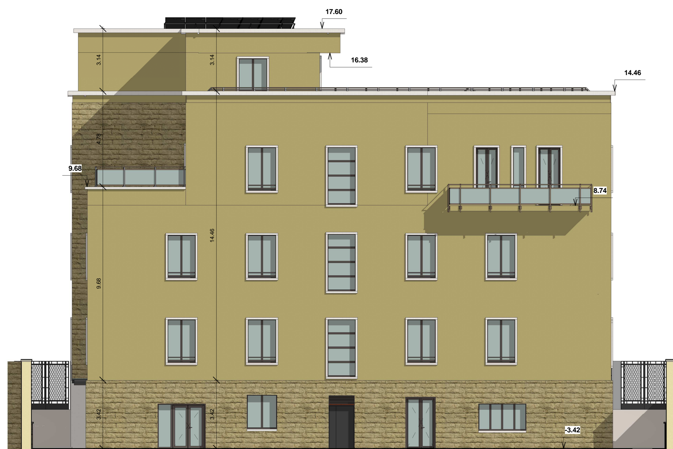
A_N-E_Progetto Prosp. Nord-Est Scala 1:100