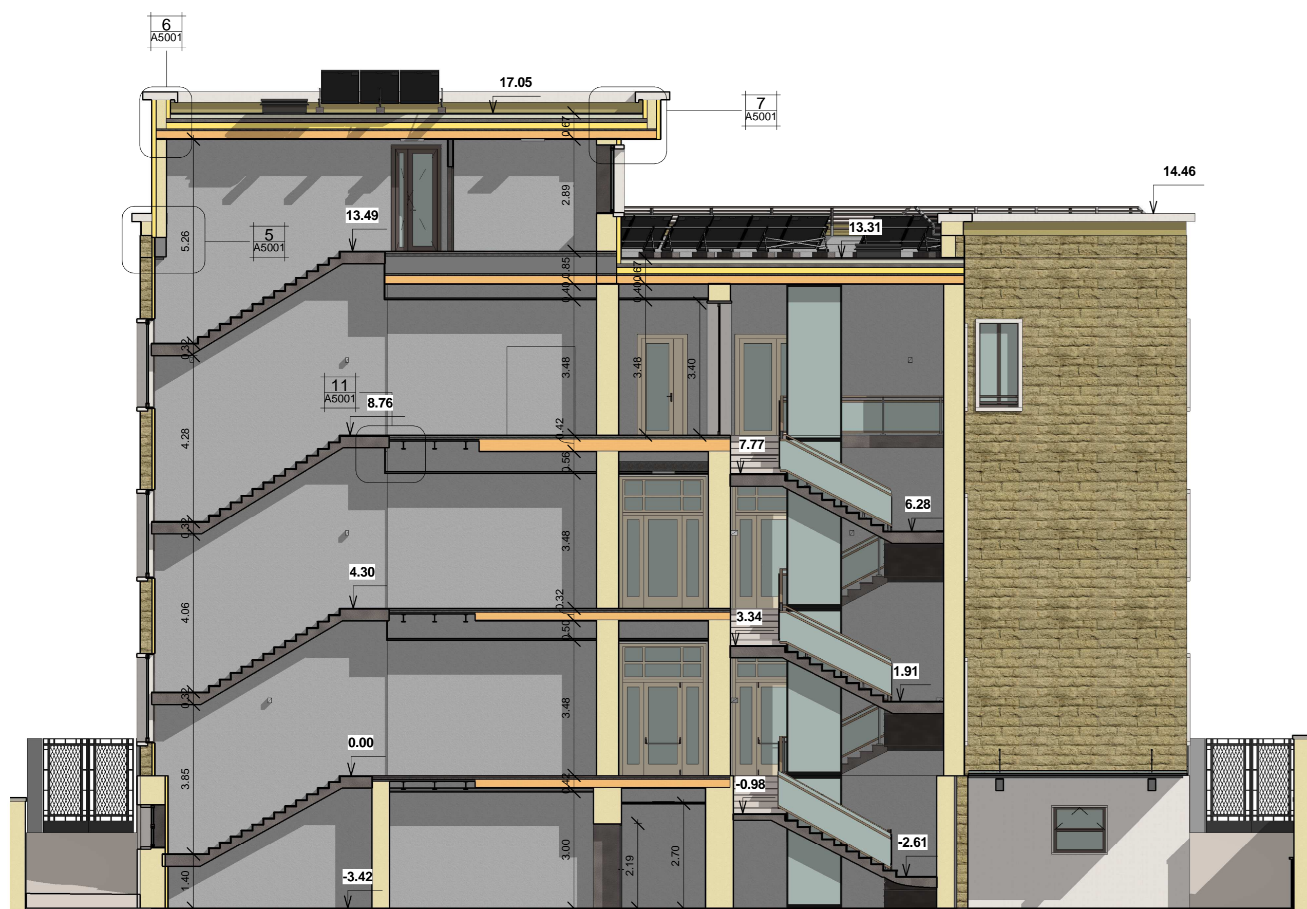
A_ZZ_Progetto Sez A-A Scala 1:100