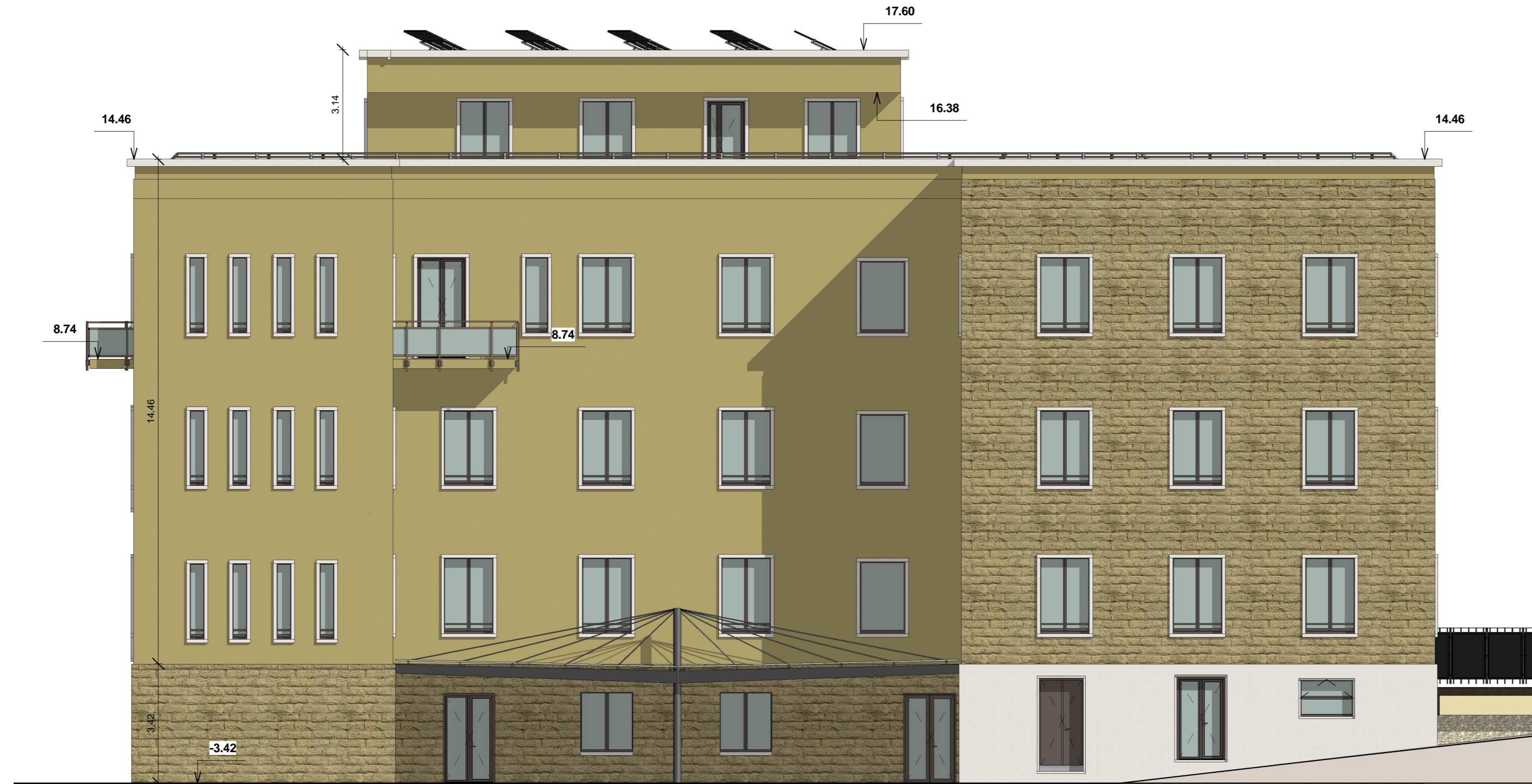
A_N-O_Progetto Prosp. Nord-Ovest Scala 1:100