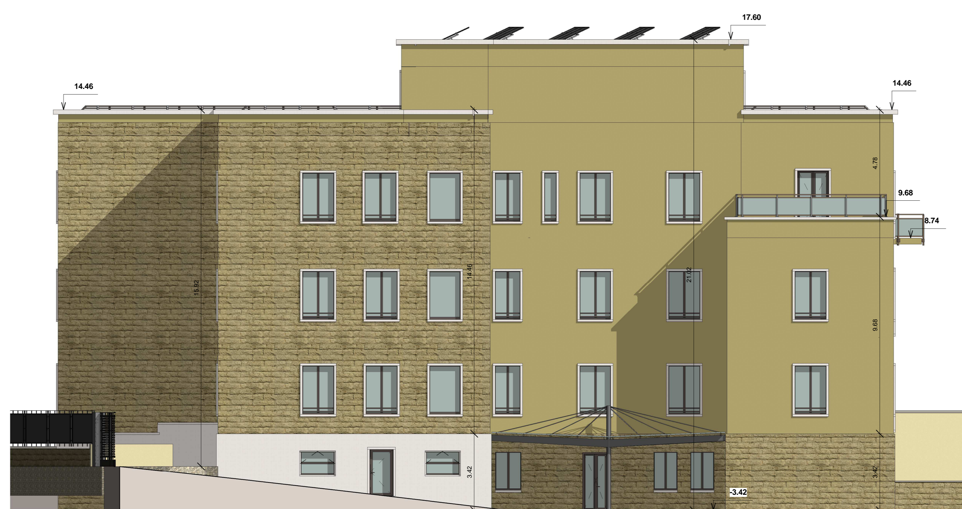
A_S-E_Progetto Prosp. Sud-Est Scala 1:100