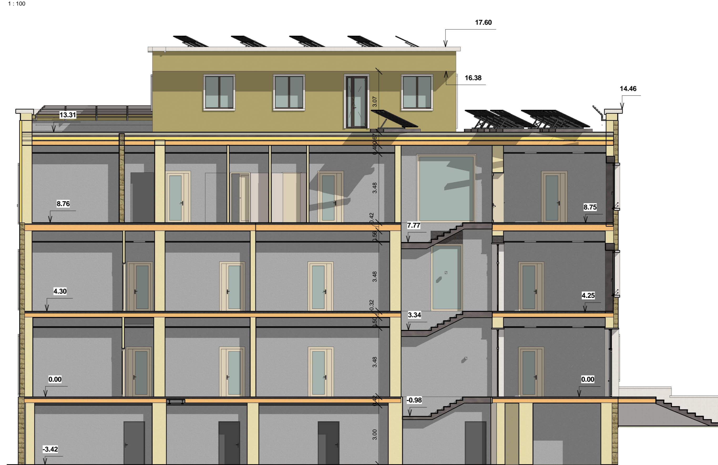
A_ZZ_Progetto Sez B-B Scala 1:100