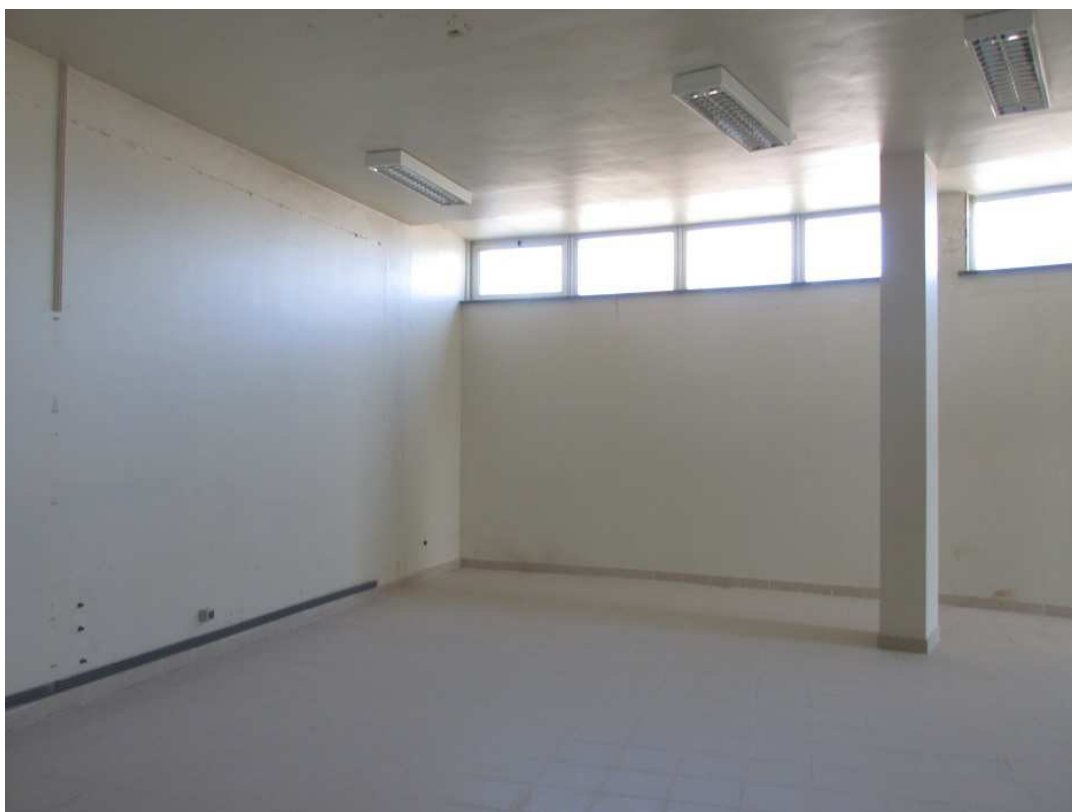
Foto 10 - aula primo piano