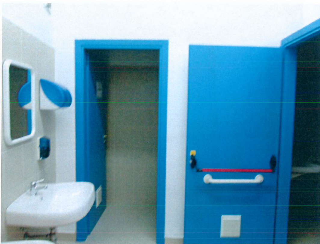
Foto 15 - bagno piano terra