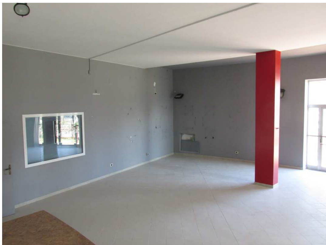
Foto 11 - auditorium piano terra