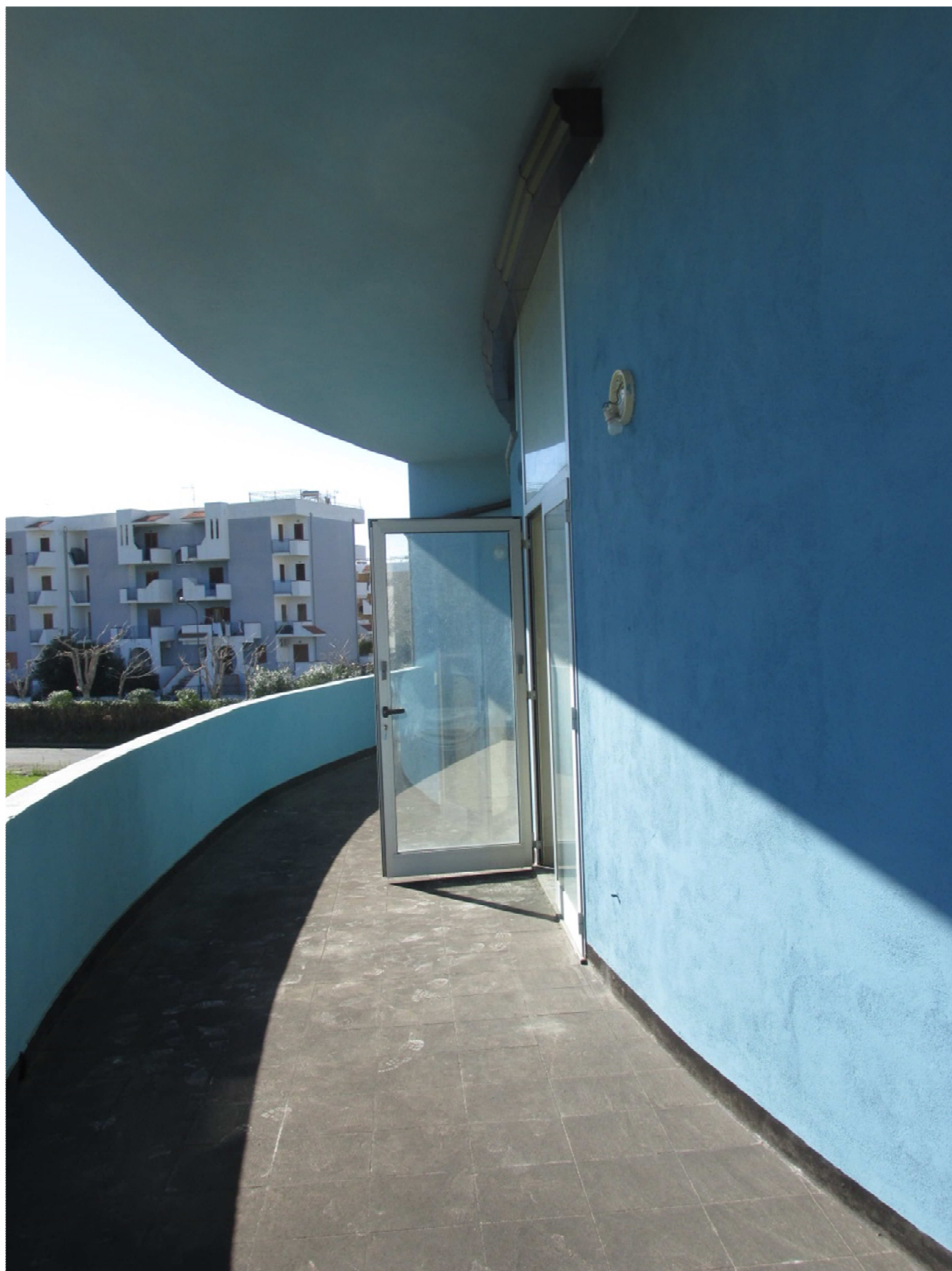
Foto 5 - terrazzo di pertinenza