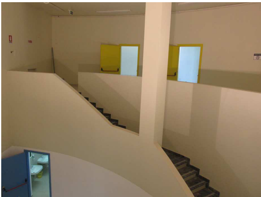
Foto 8 - scala accesso primo piano