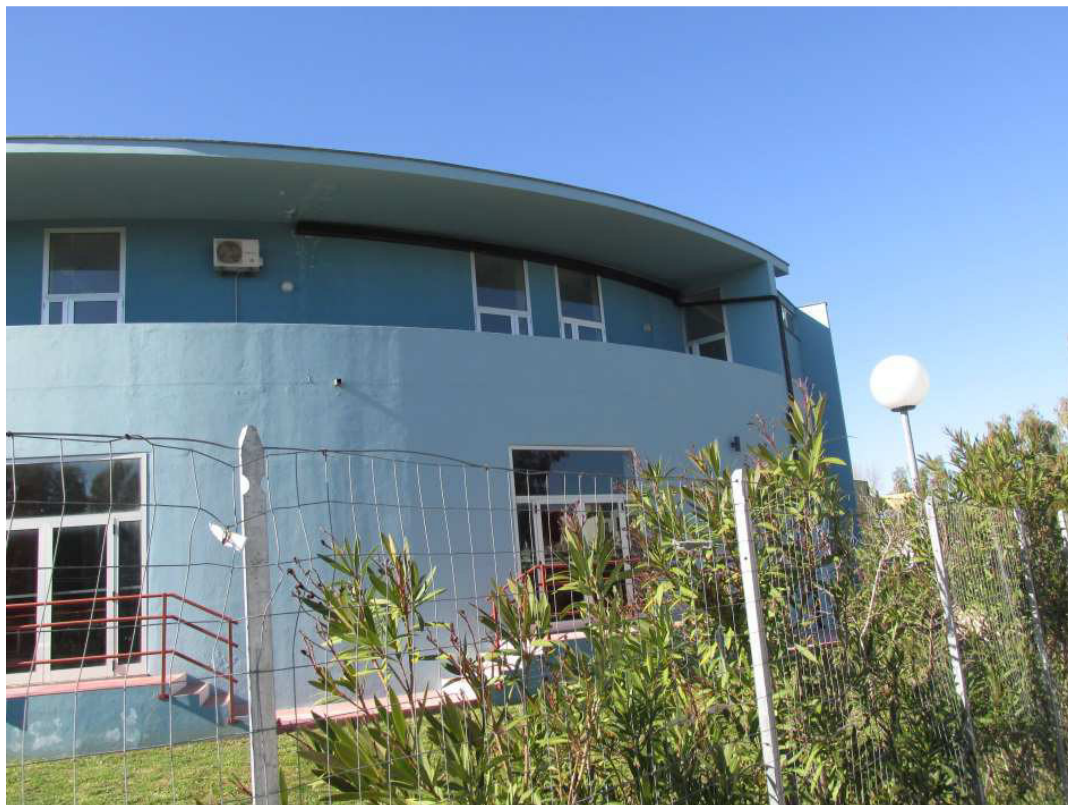
Foto 1 - prospetto sud