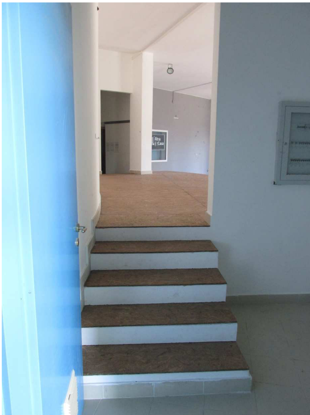
Foto 13 - auditorium piano terra