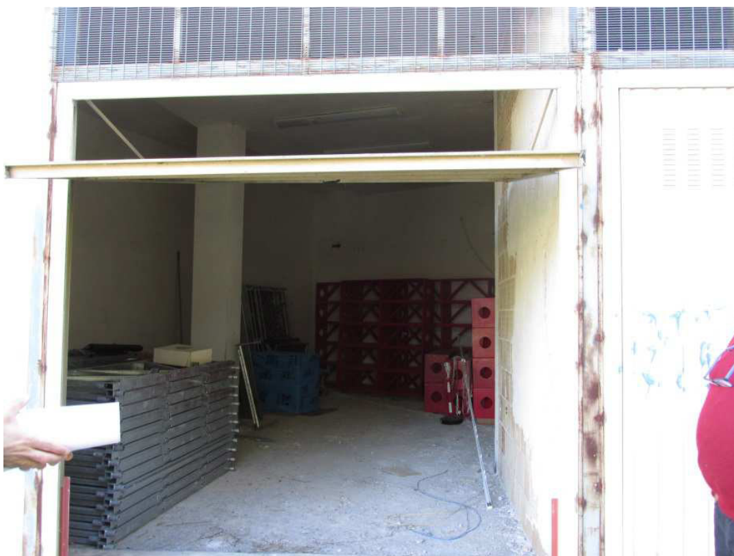
foto 7 - ingresso garage