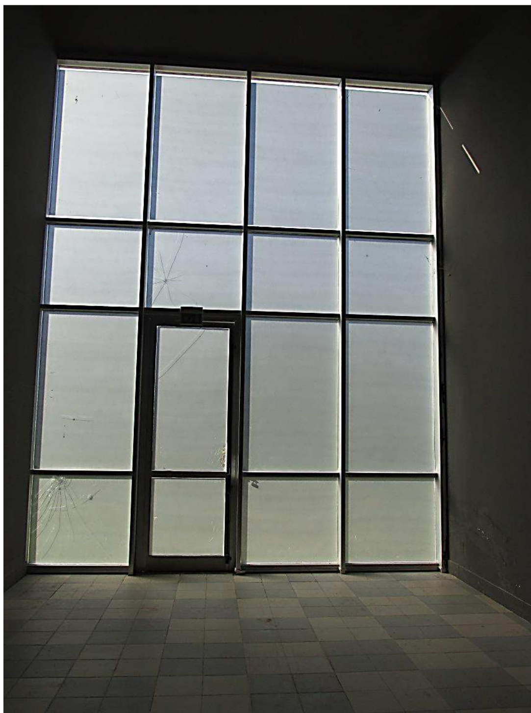
Foto 14 - spazi espositivi