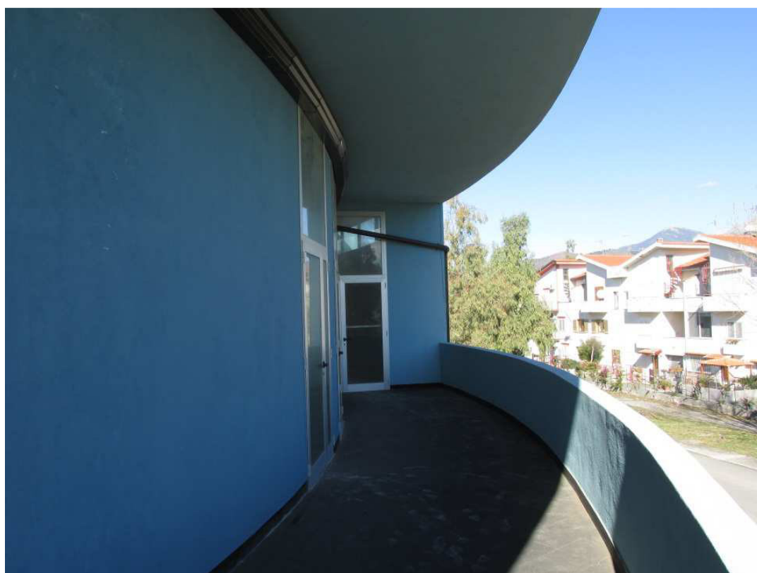
Foto 4 - terrazzo di pertinenza