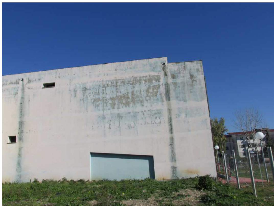
Foto 3 - prospetto ovest