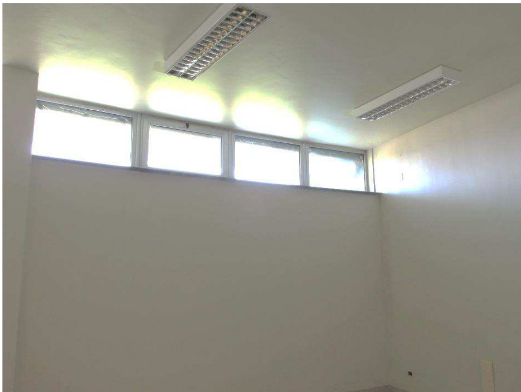
Foto 9 - interno aule primo piano