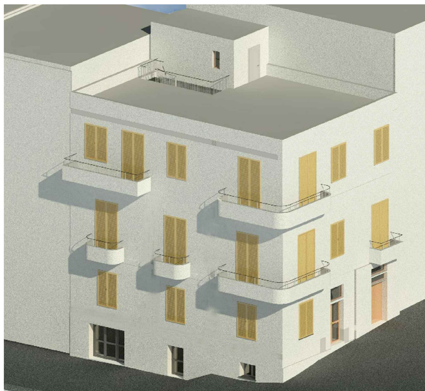
Vista 2 assonometrica