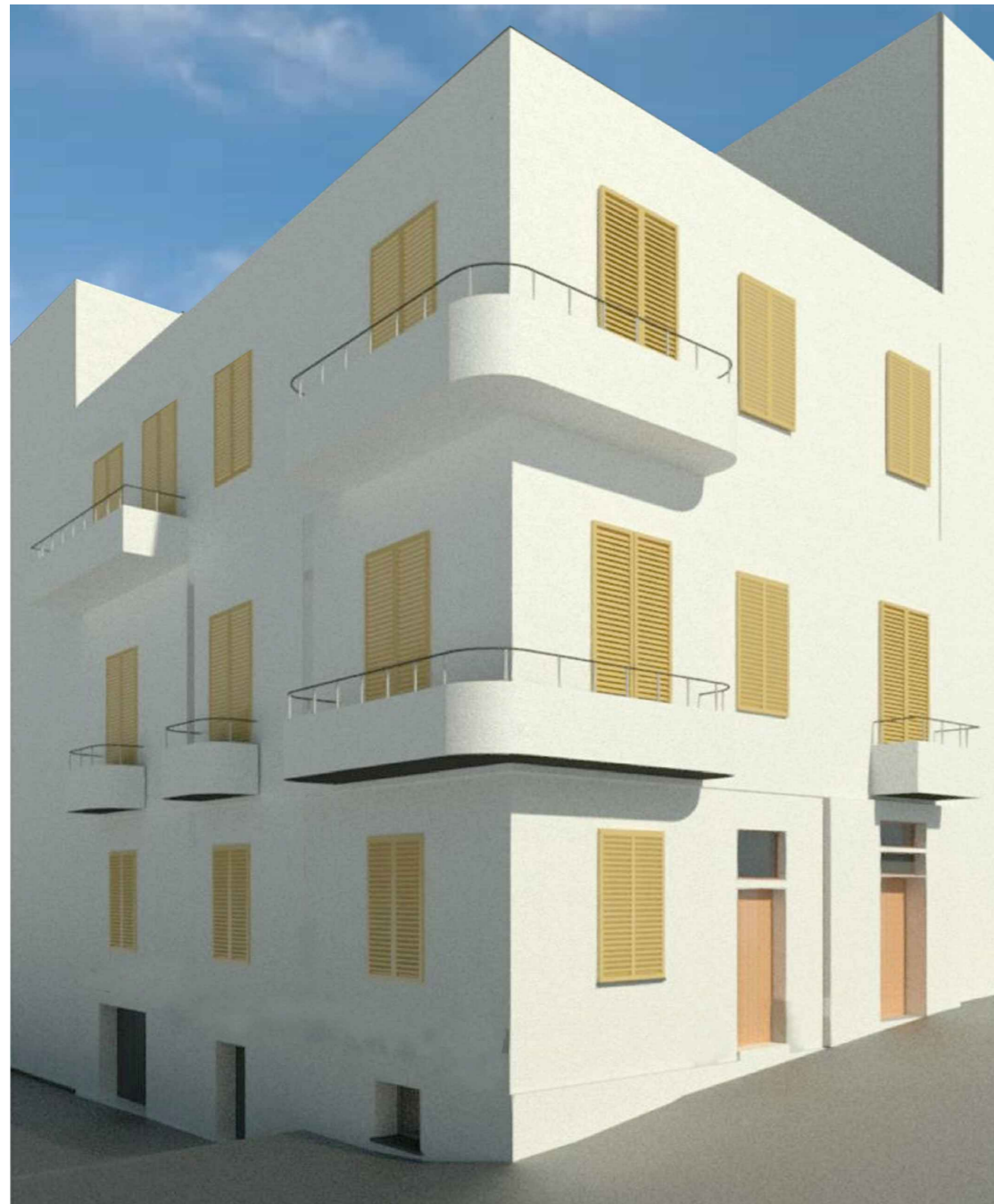
Vista 1 assonometrica