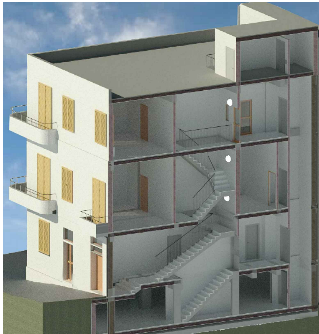
Vista 3 spaccato assonometrico