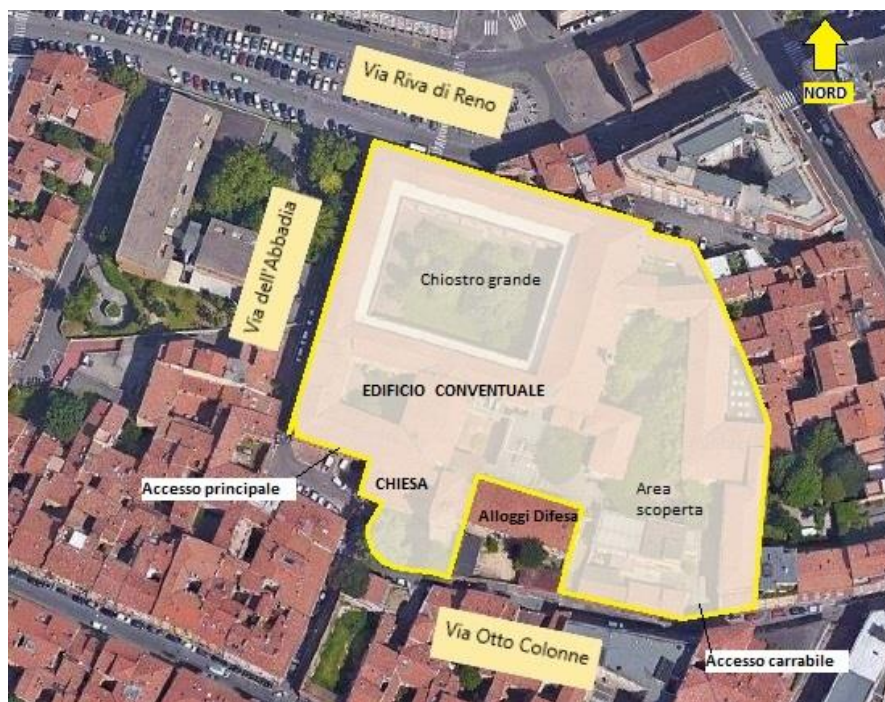
Fig.3 – Area di sedime del complesso monumentale

Il versante est dell'area di sedime è costituito da una grande area scoperta centrale, definita a nord, ad est ed a sud da costruzioni allungate disposte lungo il perimetro, nella quale sono stati edificate alcune costruzioni isolate.