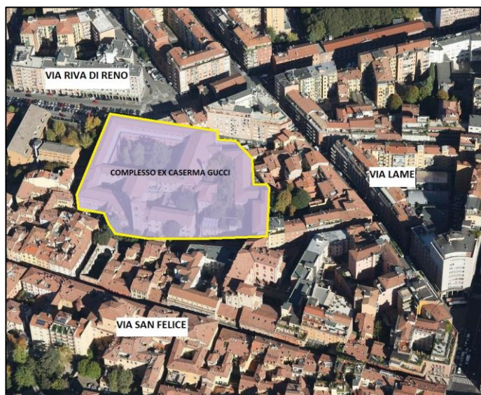
Fig.2 – individuazione del lotto di intervento

L’area di sedime si presenta edificata quasi totalmente lungo il suo perimetro, delimitato a nord dal blocco compatto di facciata che prospetta in parte su Via Riva di Reno ed in parte su spazi aperti di proprietà aliena.