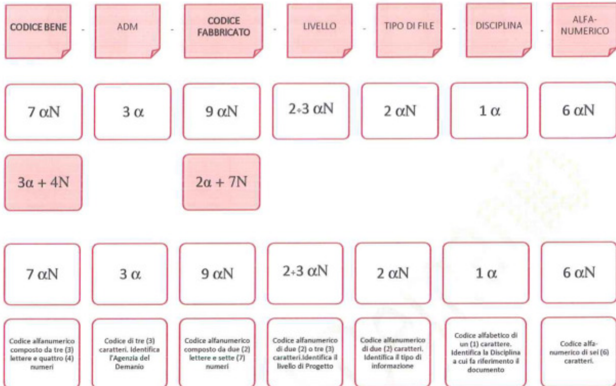
Esempio di codifica dei modelli

Di seguito è riportata lo schema tipico della codifica su citata a titolo esemplificativo e non esaustivo: