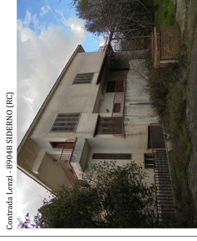
Contrada Lenzi - 09046 SIDERNO (RC)