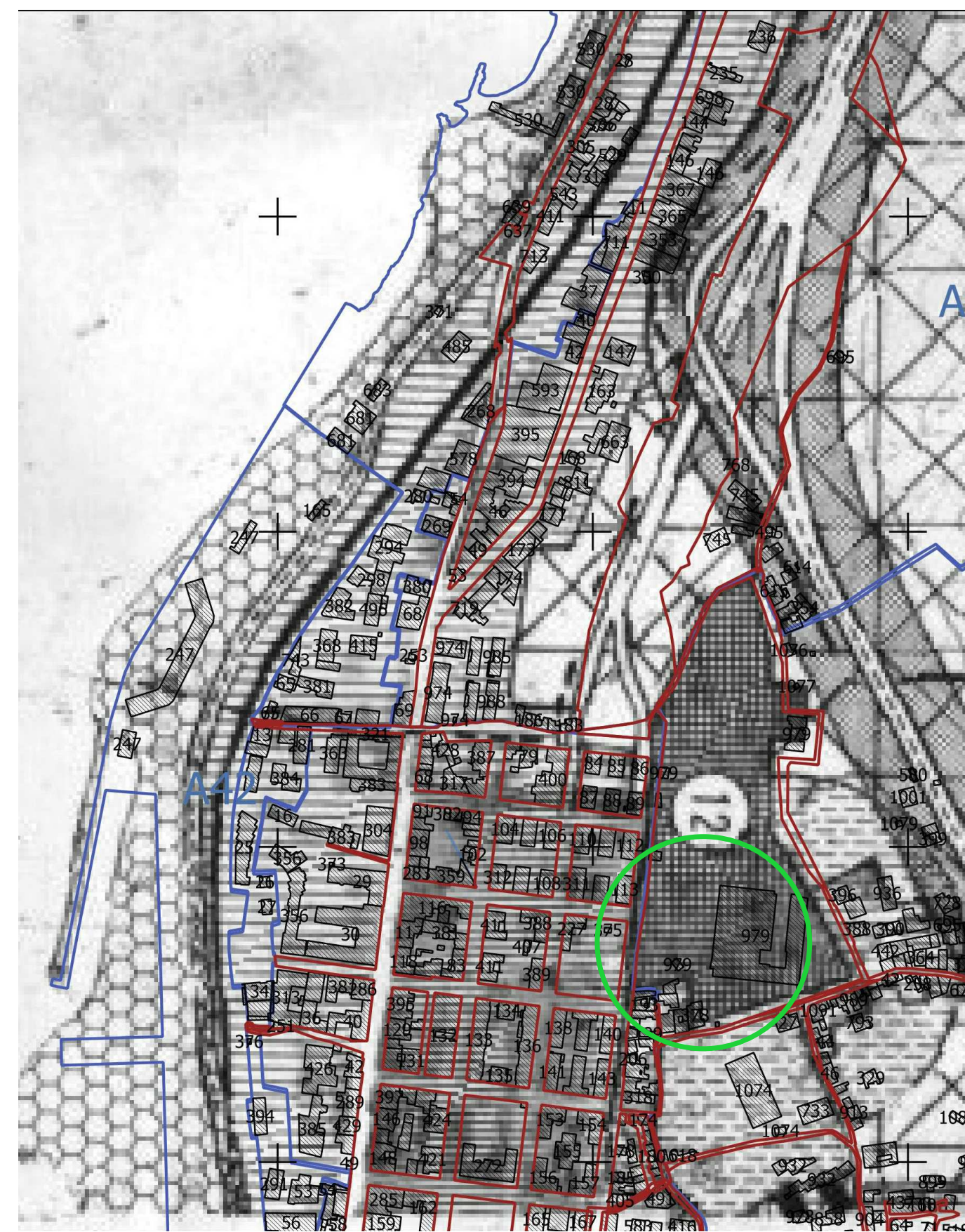
[Green circle symbol] LIMITE AREA D'INTERVENTO