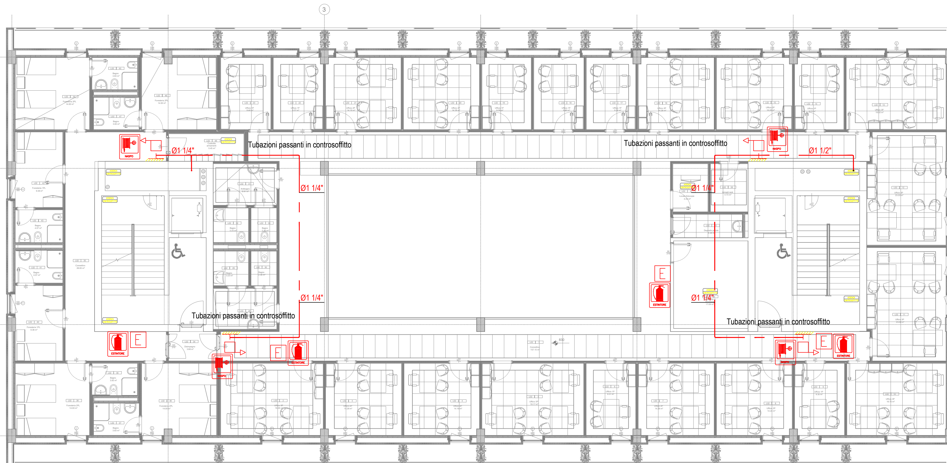
PIANTA PIANO SECONDO