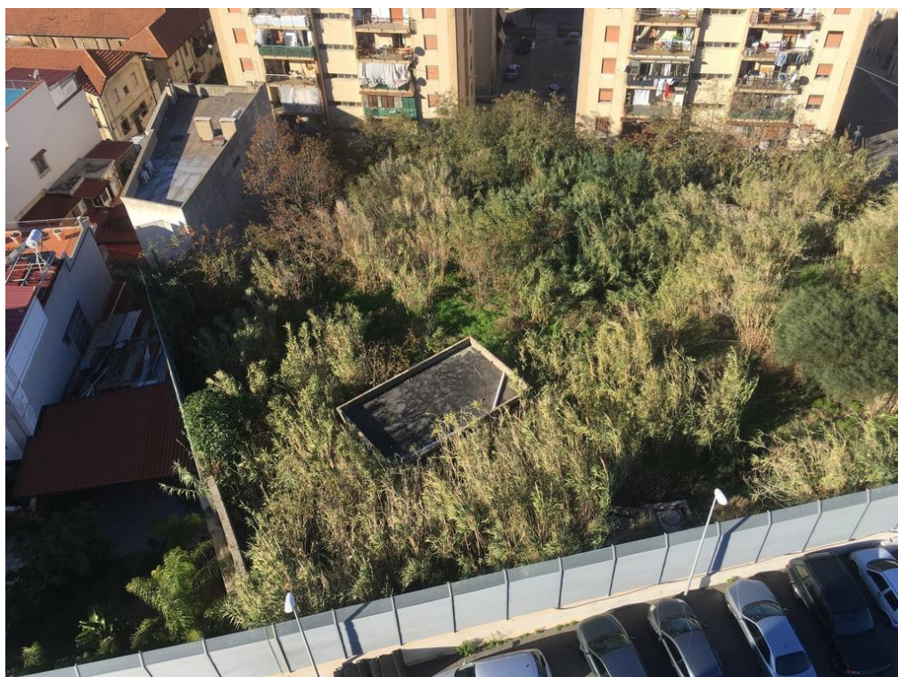
Vista della zona sud dell'area di progetto