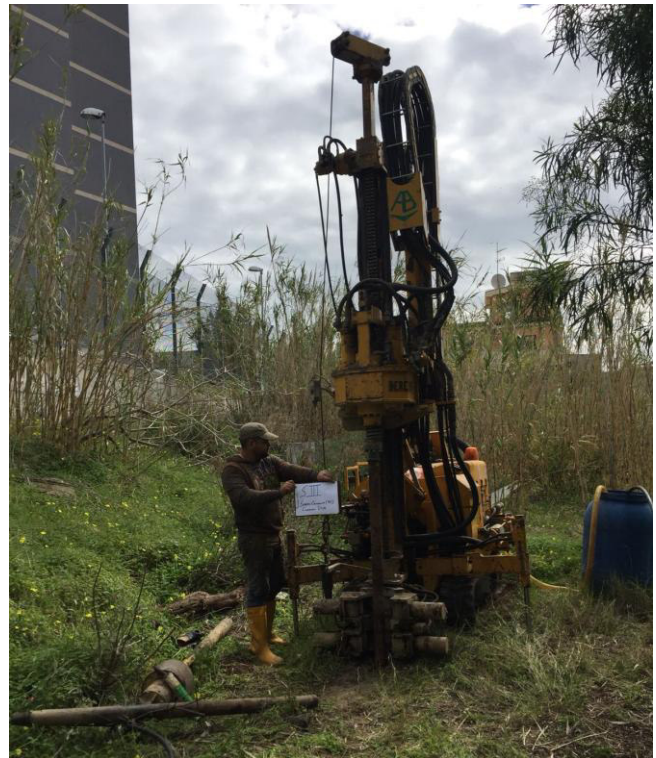
Macchinario impiegato per le indagini