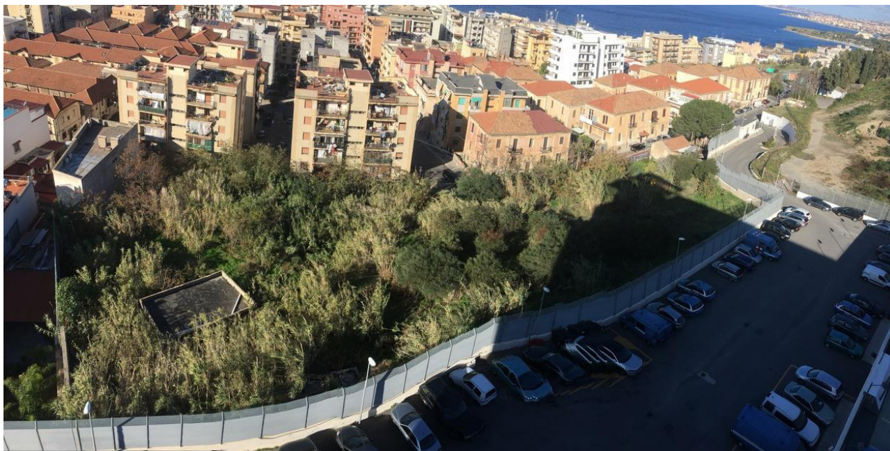
Vista generale dell'area di progetto