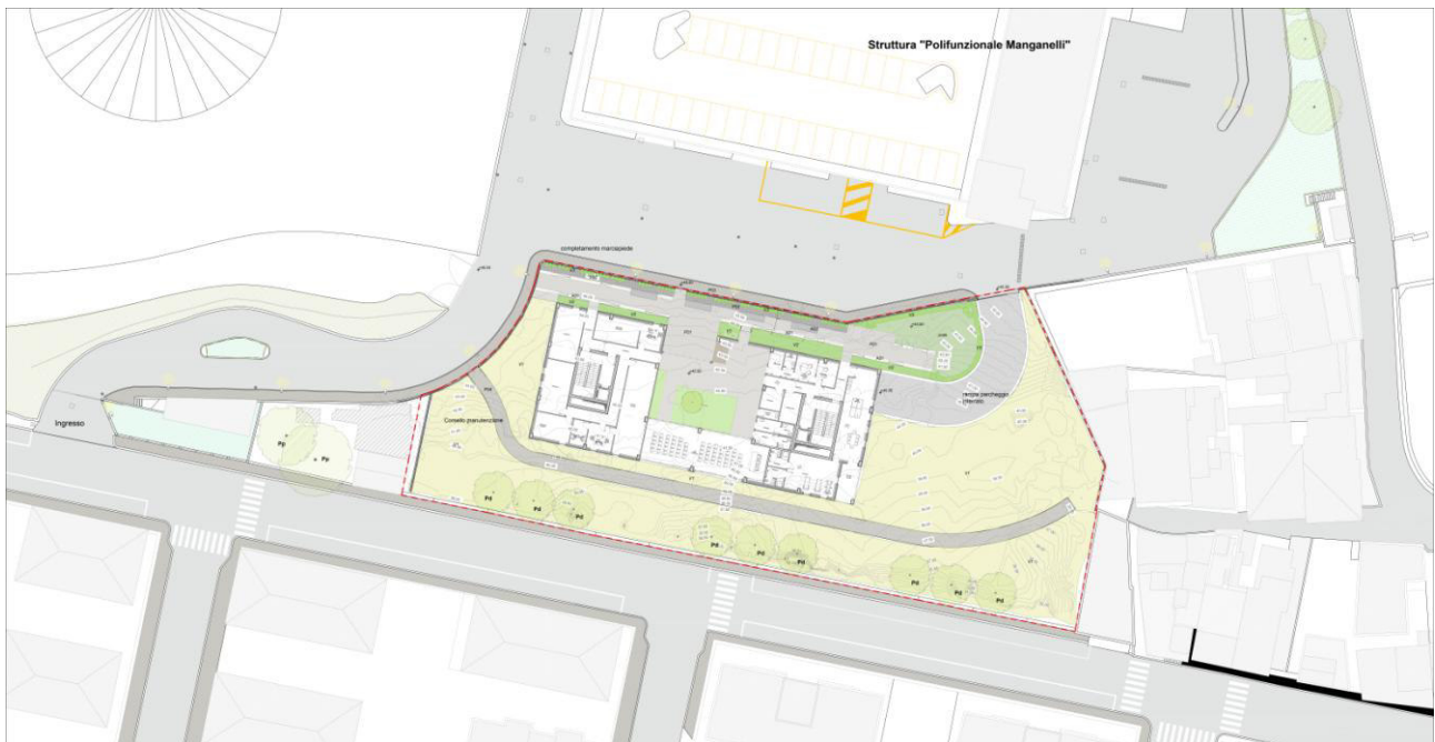
Planimetria area di progetto

Affidamento dei servizi di progettazione definitiva ed esecutiva, coordinamento della sicurezza in fase di progettazione e di esecuzione, direzione lavori, contabilità dei lavori ed accatastamento, finalizzati alla realizzazione della nuova sede della D.I.A., sita in Reggio Calabria, Località Santa Caterina