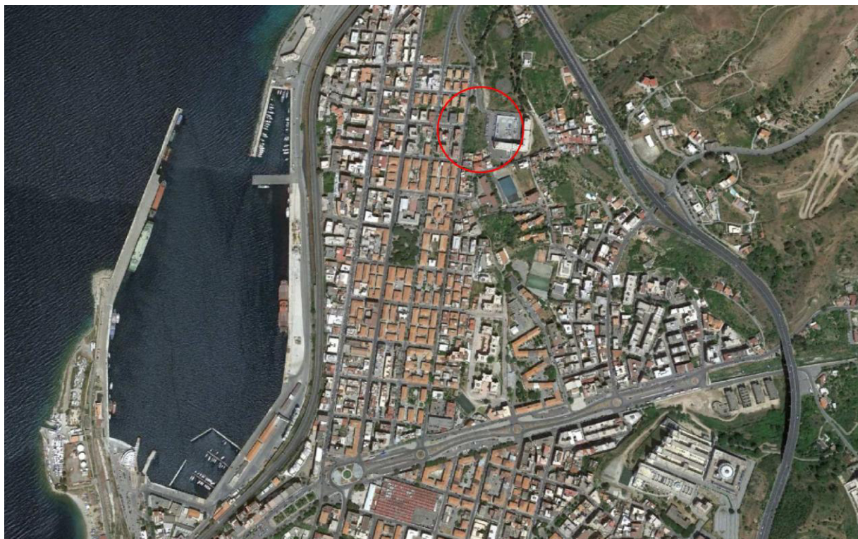
Ortofoto del quartiere Santa Caterina nella zona Nord del comune di Reggio Calabria

La fase di progettazione sarà preceduta da indagini preliminari geologiche sull’area.