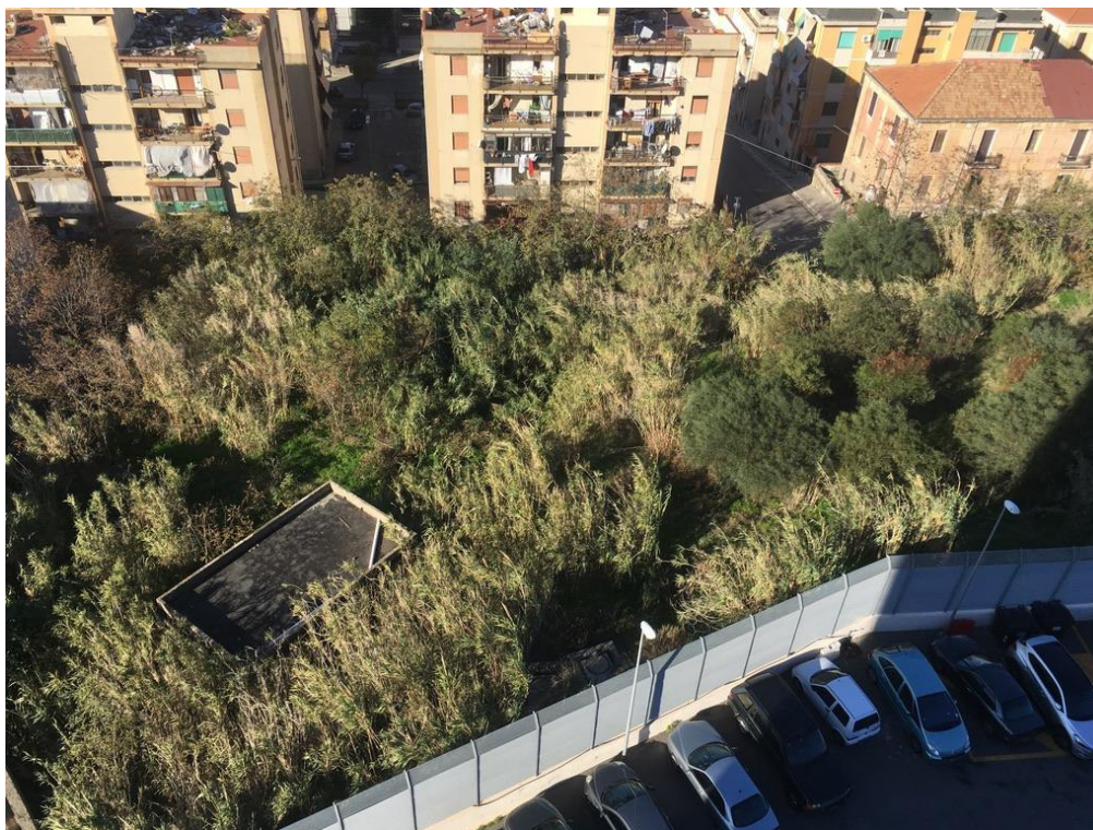
Vista della zona sud dell'area di progetto

Affidamento dei servizi di progettazione definitiva ed esecutiva, coordinamento della sicurezza in fase di progettazione e di esecuzione, direzione lavori, contabilità dei lavori ed accatastamento, finalizzati alla realizzazione della nuova sede della D.I.A., sita in Reggio Calabria, Località Santa Caterina