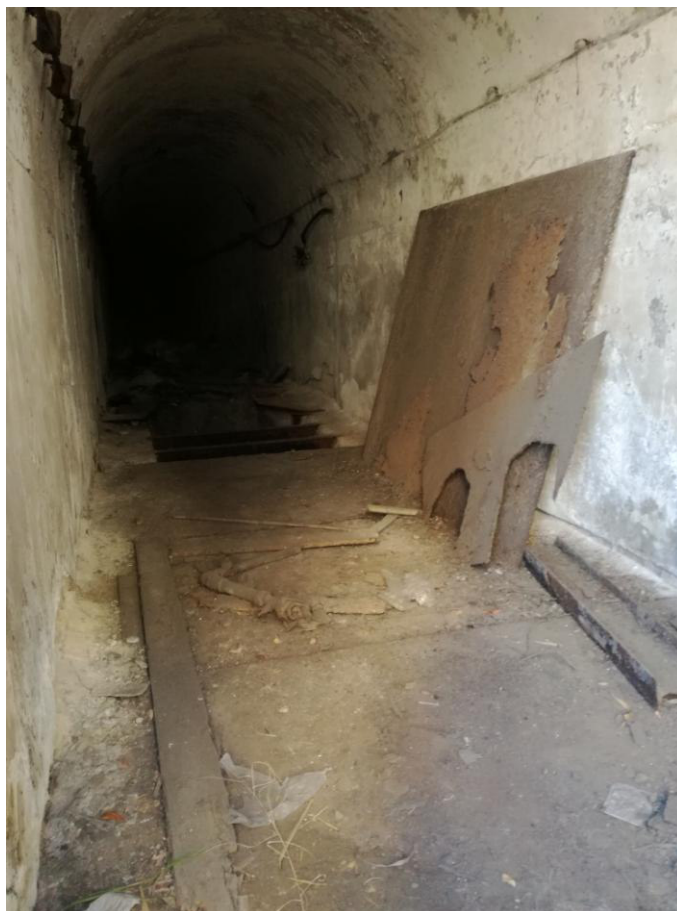
Tunnel per il collegamento con l'area cisterne

Affidamento dei servizi di progettazione definitiva ed esecutiva, coordinamento della sicurezza in fase di progettazione e di esecuzione, direzione lavori, contabilità dei lavori ed accatastamento, finalizzati alla realizzazione della nuova sede della D.I.A., sita in Reggio Calabria, Località Santa Caterina