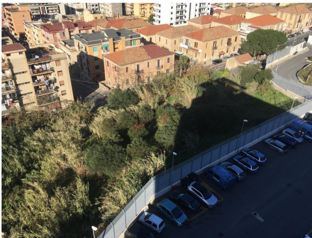
Vista della zona nord dell'area di progetto