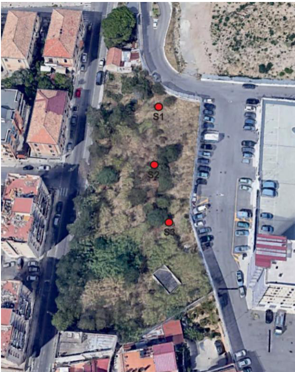
Ortofoto ubicazione indagini

La composizione delle "carote" è caratterizzata in prevalenza da terreno sciolto, di matrice sabbiosa, talvolta ricco di inclusi litici, per lo più ciottoli, sintomo di probabili movimenti di "dilavamento" dalla collina soprastante. L'assenza di materiale archeologico è un fattore determinante, ma non assoluto in quanto i campioni sono limitati a una brevissima porzione dell'intera area progettuale.