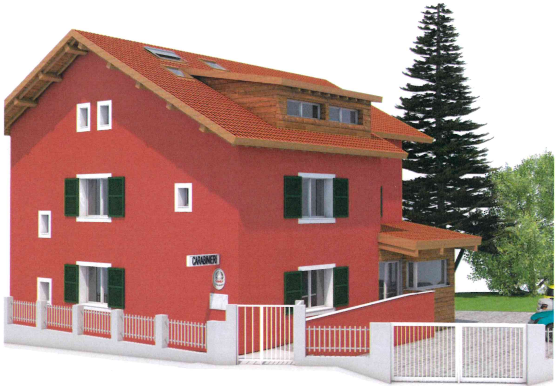
Prospetti Ovest e Sud