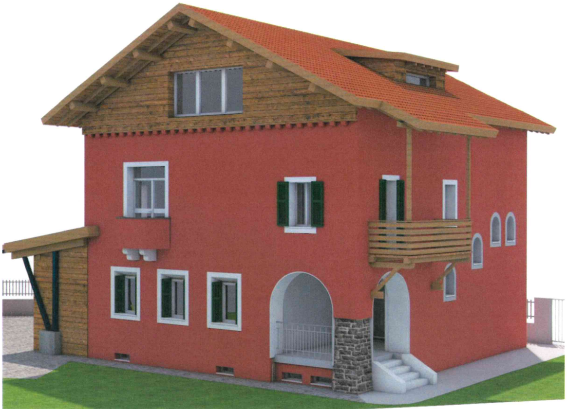
Prospetti Est e Nord |