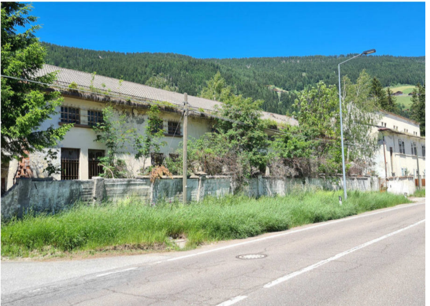
vista fronte strada - edificio "A" e "B"