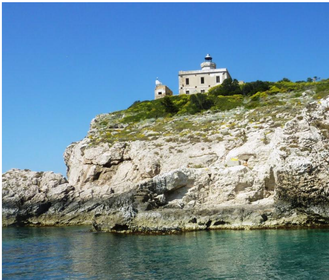
Località Punta del Diavolo – 71040 Isola di San Domino (FG)