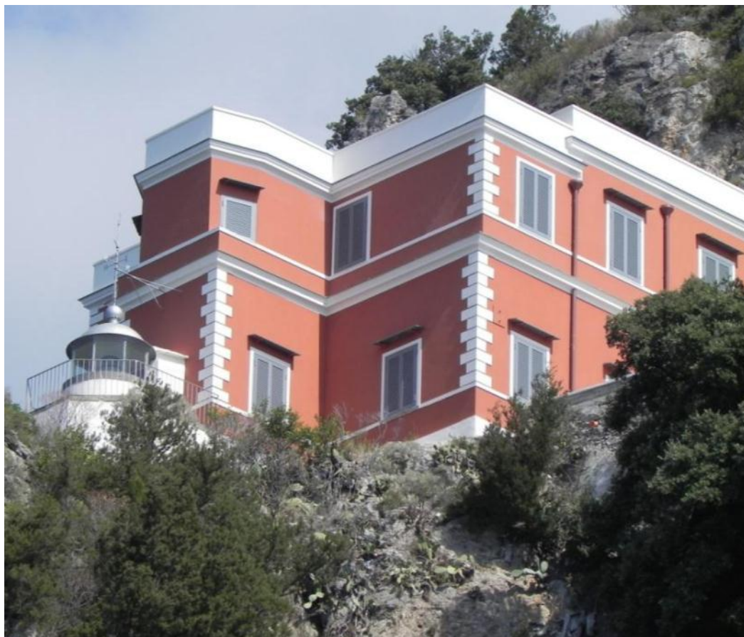
Strada Statale amalfitana – 84010 Maiori (SA)