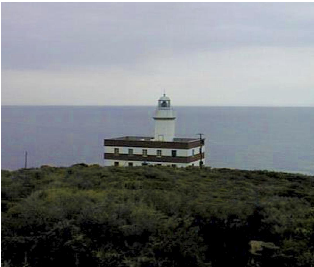
Località Isola del Giglio – 58012 (GR)