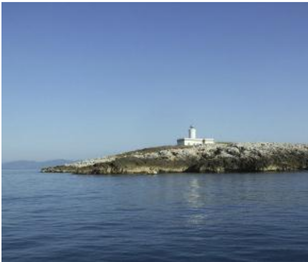
Località Isola Formica Grande – 58100 Grosseto (GR)