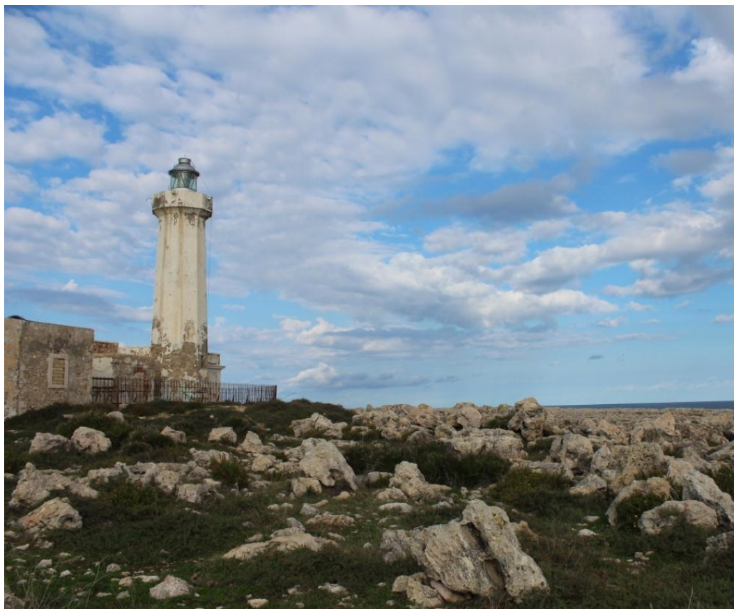
Strada provinciale 110 località Murro di Porco – 96100 Siracusa