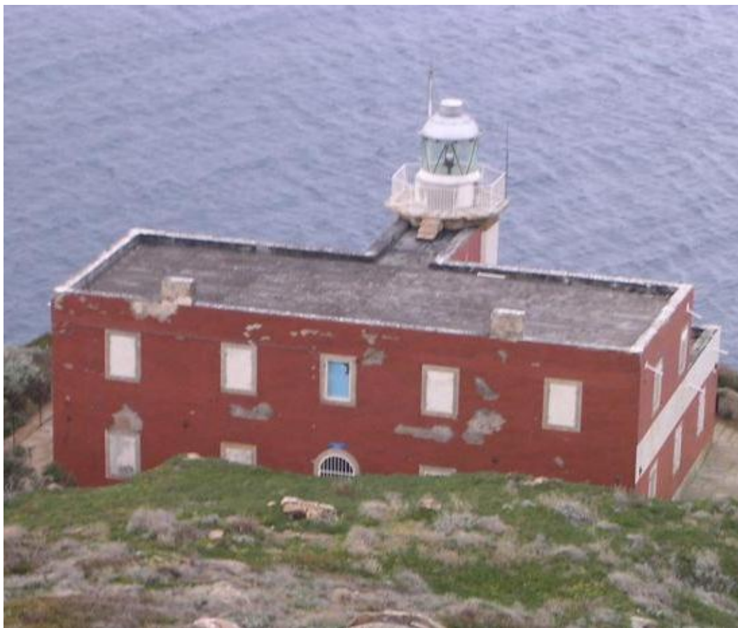
Località Isola del Giglio – 58012 (GR)