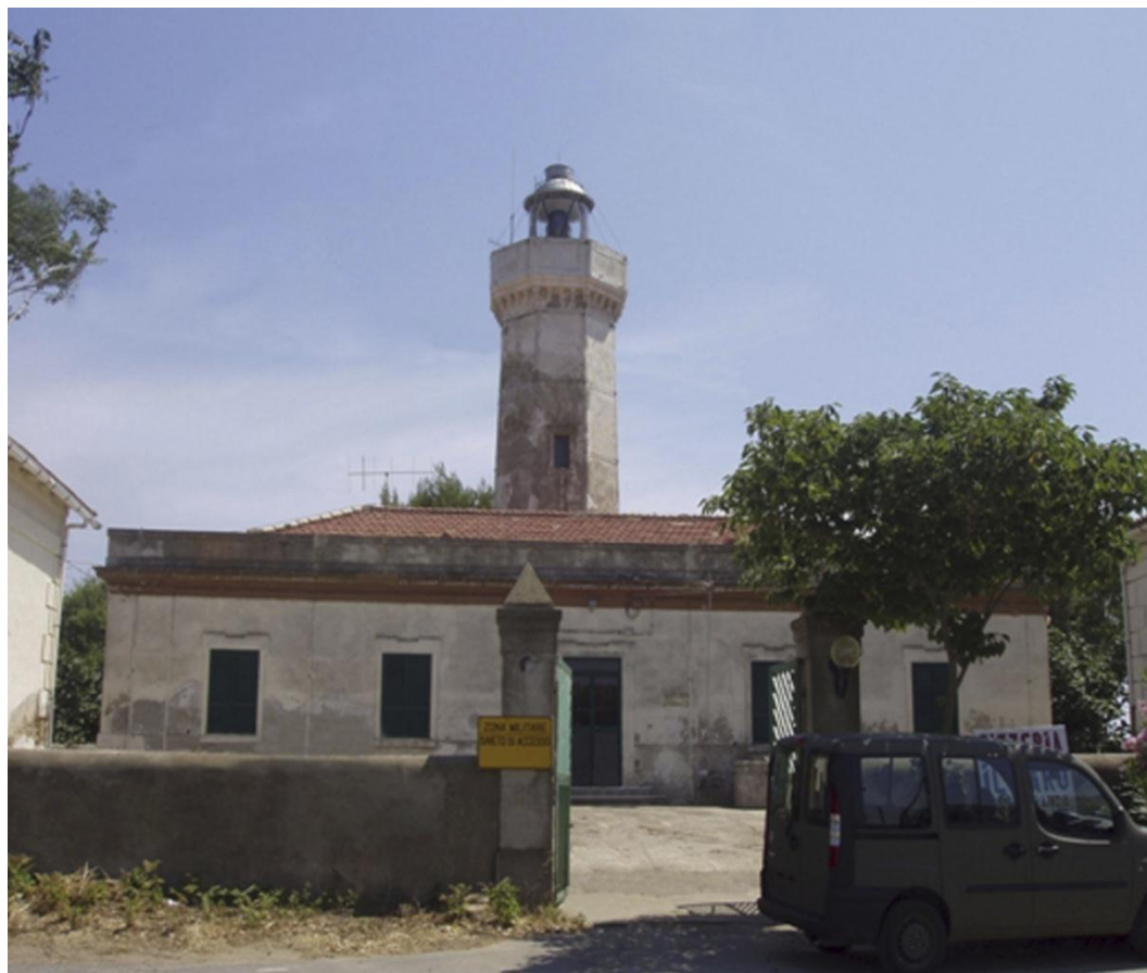
Località Capo Rizzuto - Isola di Capo Rizzuto (Crotona)