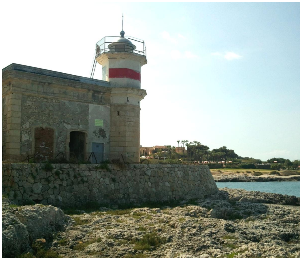
Piazza Castello Regina Giovanna – 08020 Augusta (frazione di Brucoli)