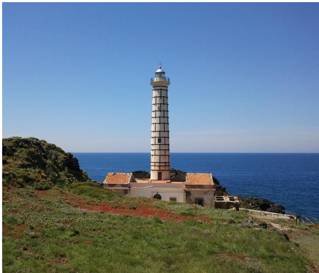
Località Punta dello Spalmatore - 90010 Ustica