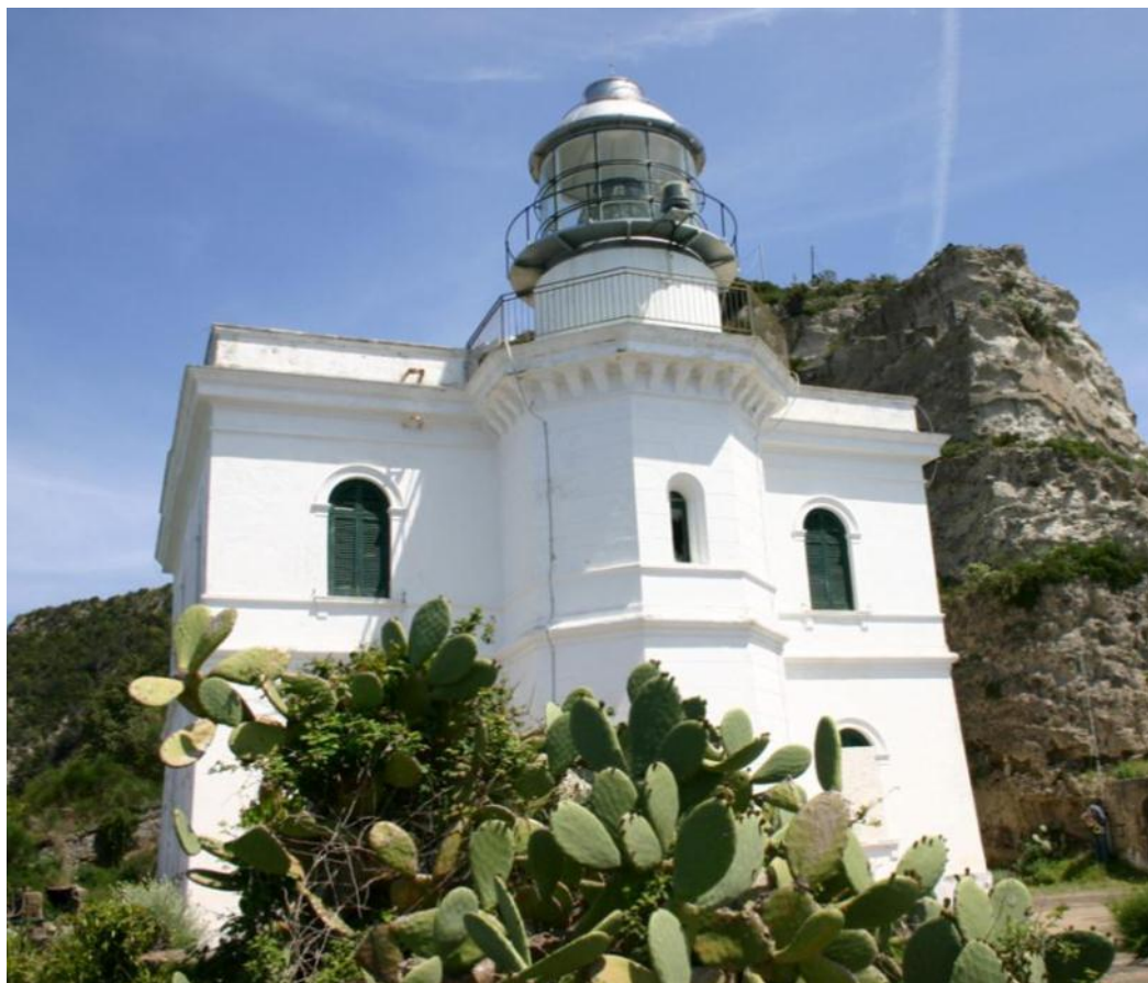
Località Punta Imperatore, via costa – 80075 Forio d'Ischia NA)