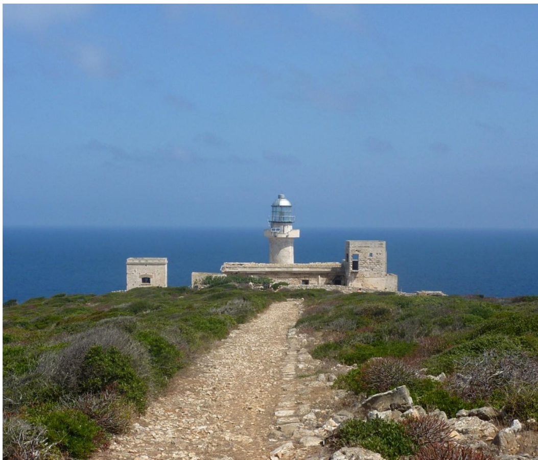
Strada Capogrosso – 91010 Isola di Levanzo, Favignana