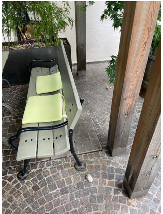
Foto 4: Vista sulla pavimentazione del cortile interno con la presenza di calcinacci