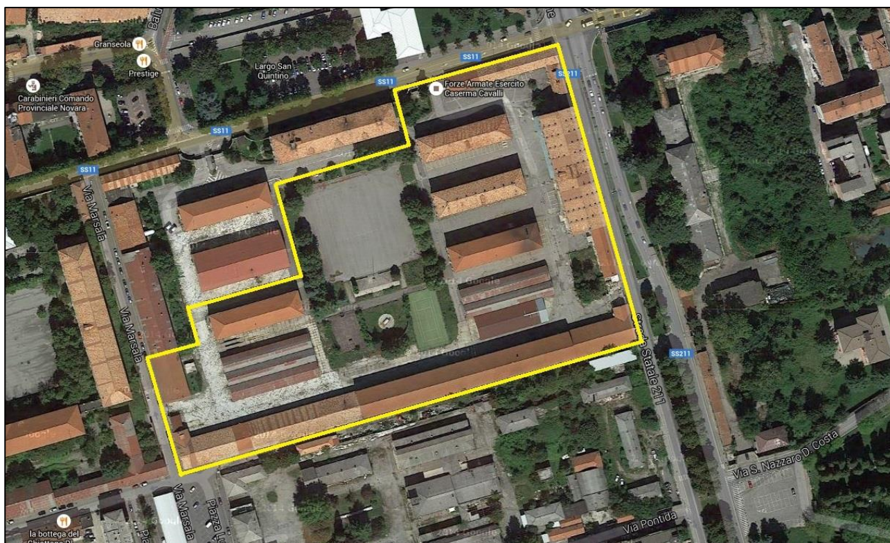
Individuazione dell'immobile (perimetro giallo)