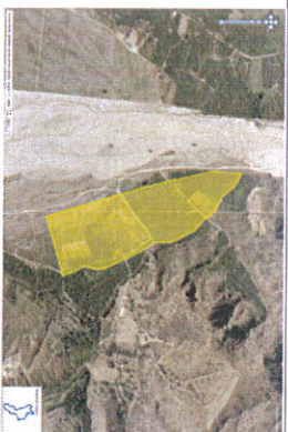
Perimetro particella 84

Descrizione: Area pianeggiante di mq. 8650 sito nella sponda sinistra della fiumara Amendolea facente parte della Scheda RCB0701, identificata al C.T. fg. 53 p.lla 84, nella rappresentazione sopra con le lettere «o» ed «n» ed accesso dalla «b3», di consistenza totale mq. 8650. La stessa è utilizzata con contratto di locazione in scadenza al 31/12/2017.